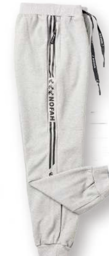
保暖針織搖粒長褲 8843-2 灰色 棉 100% $1850