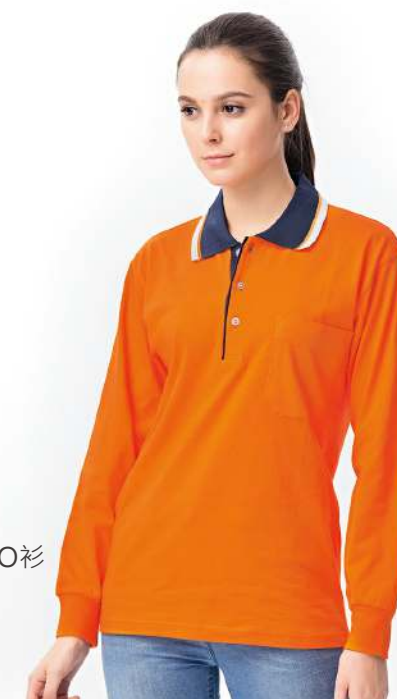
純棉長袖POLO衫 2913-7 橘色 棉 100% $1100