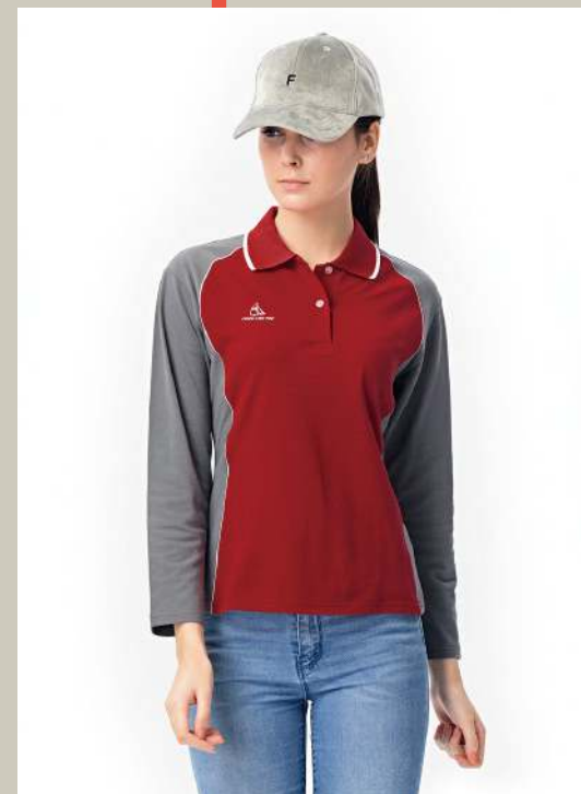
女款-快乾棉長袖POLO衫 2369-1 紅色/灰色 天然棉 51.2% 聚酯纖維 48.8% 快乾棉排汗布(吸濕排汗原紗) $1250