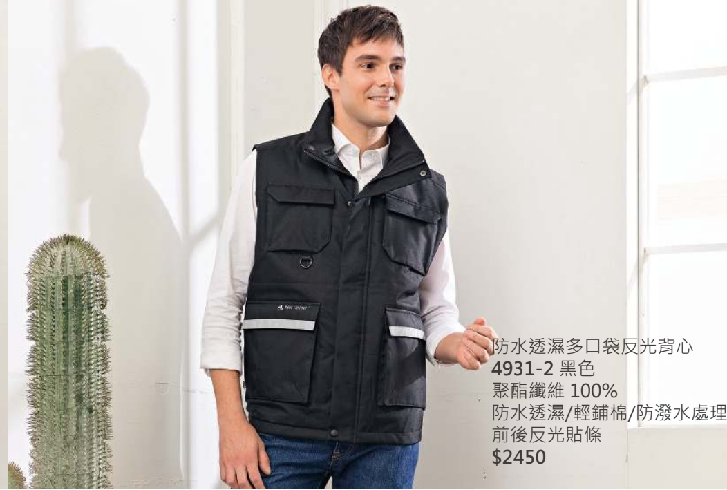
防水透濕多口袋反光背心 4931-2 黑色 聚酯纖維 100% 防水透濕/輕鋪棉/防潑水處理 前後反光貼條 $2450