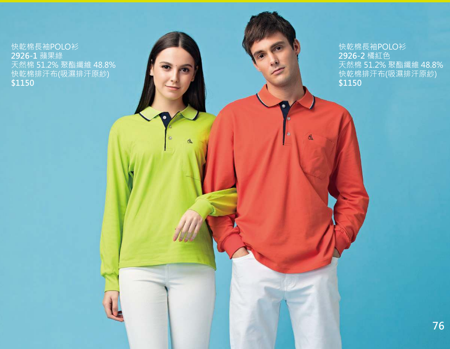
快乾棉長袖POLO衫 2926-1 蘋果綠 天然棉 51.2% 聚酯纖維 48.8% 快乾棉排汗布(吸濕排汗原紗) $1150