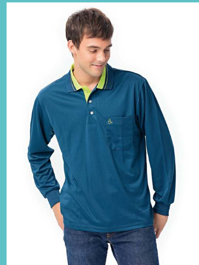
吸濕排汗長袖POLO衫 2436-2 灰藍色 聚酯纖維 100% (吸濕排汗原紗) $1250