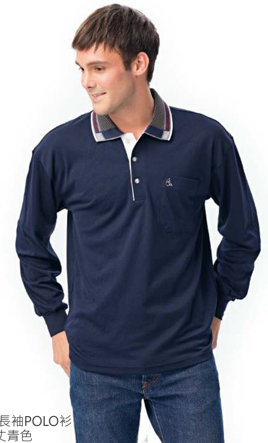
CVC排汗長袖POLO衫 2612-2 丈青色 聚酯纖維 65% 棉35% 快乾棉排汗布(吸濕排汗原紗) $1200