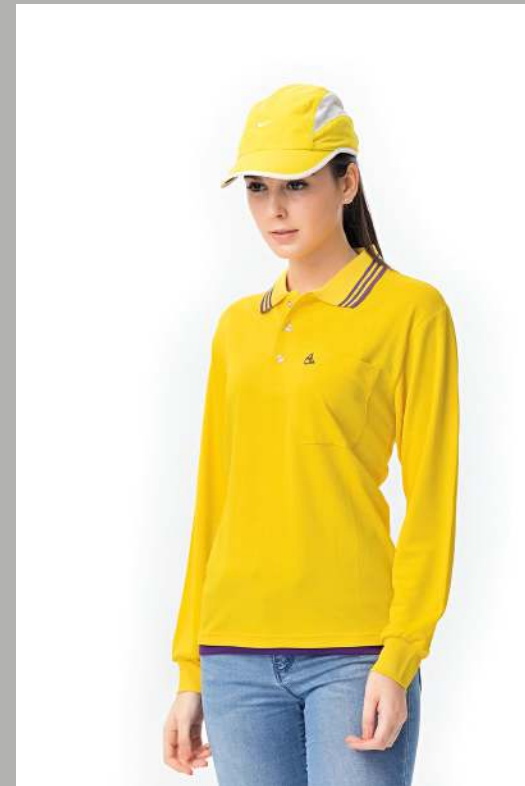
吸濕排汗長袖POLO衫 2131-1 黃色 聚酯纖維 100% (吸濕排汗原紗) $1250