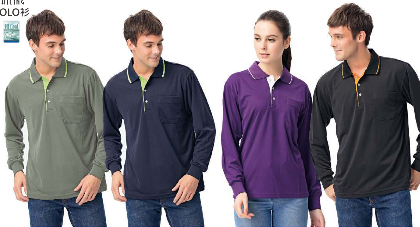
吸濕排汗長袖POLO衫 2346-1 灰色 聚酯纖維 100% (吸濕排汗原紗) $1050 吸濕排汗長袖POLO衫 2346-2 丈青色 聚酯纖維 100% (吸濕排汗原紗) $1050 吸濕排汗長袖POLO衫 2347-1 紫色 聚酯纖維 100% (吸濕排汗原紗) $1050 吸濕排汗長袖POLO衫 2347-2 黑色 聚酯纖維 100% (吸濕排汗原紗) $1050