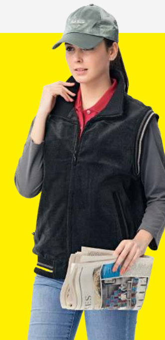
高級毛呢背心 4131-1 黑色 聚酯纖維 100% 高級仿羊絨布 $1950