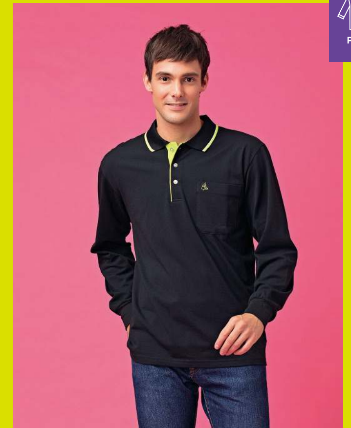
快乾棉長袖POLO衫 2926-3 黑色 天然棉 51.2% 聚酯纖維 48.8% 快乾棉排汗布(吸濕排汗原紗) $1150