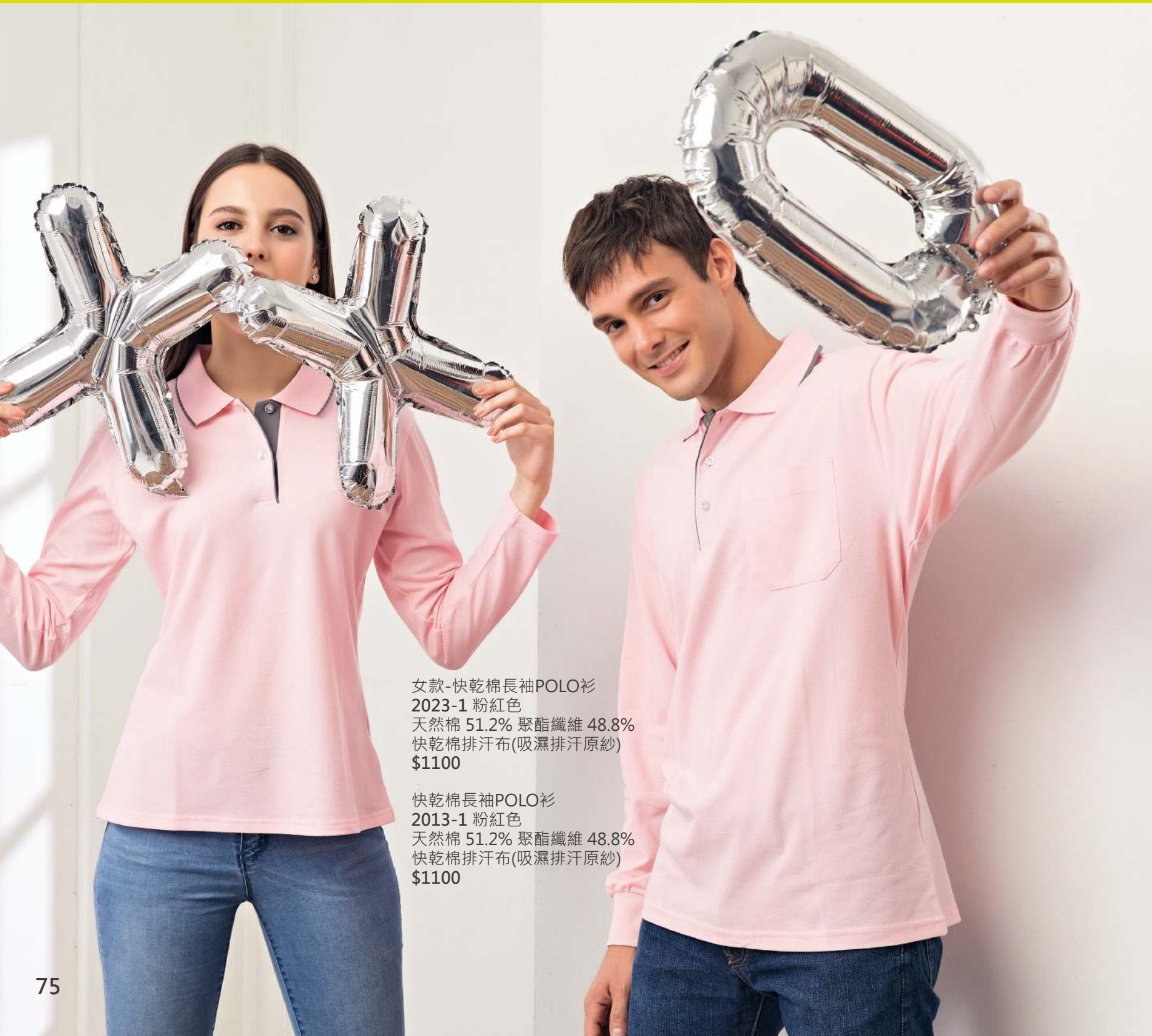
女款-快乾棉長袖POLO衫 2023-1 粉紅色 天然棉 51.2% 聚酯纖維 48.8% 快乾棉排汗布(吸濕排汗原紗) $1100