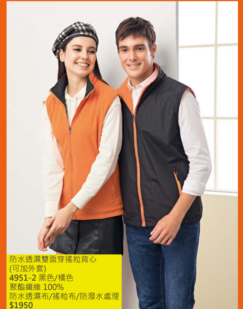
防水透濕雙面穿搖粒背心 (可加外套) 4951-2 黑色/橘色 聚酯纖維 100% 防水透濕布/搖粒布/防潑水處理 $1950