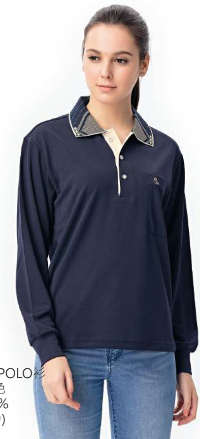
吸濕排汗長袖POLO衫 2811-2 丈青色 聚酯纖維 100% (吸濕排汗原紗) $1250