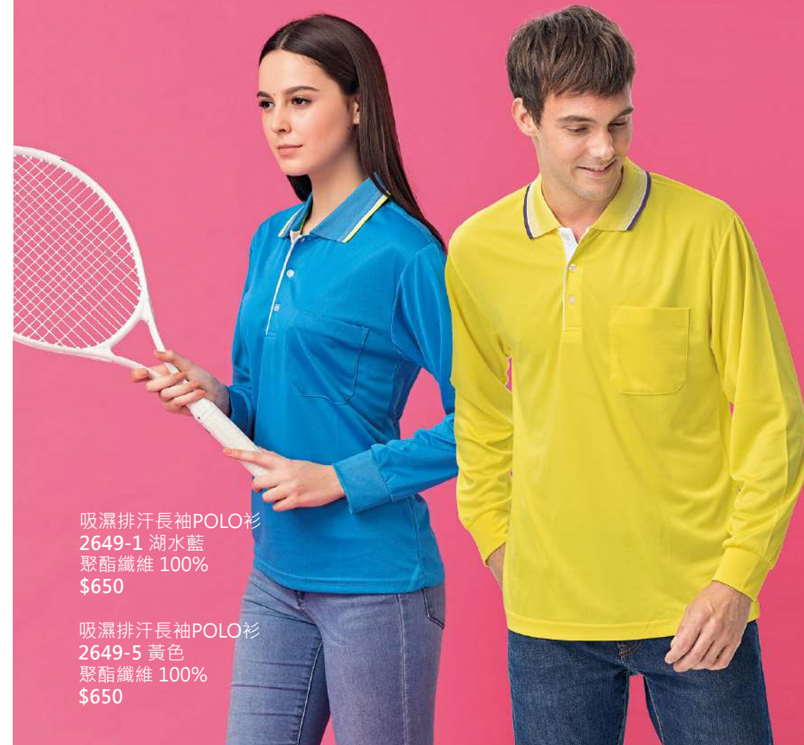
吸濕排汗長袖POLO衫 2649-1 湖水藍 聚酯纖維 100% $650 吸濕排汗長袖POLO衫 2649-5 黃色 聚酯纖維 100% $650