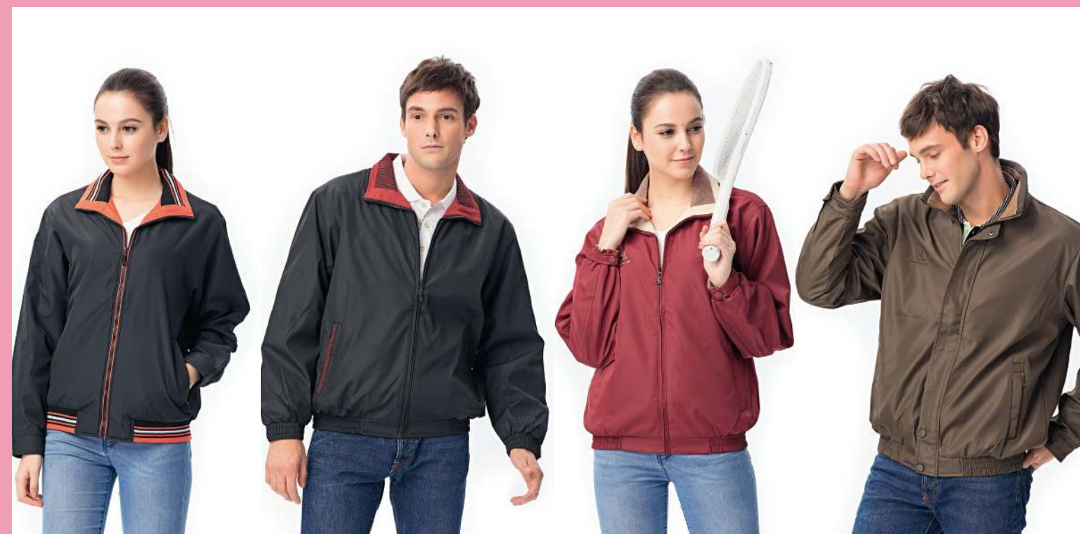
鋪棉外套 4345-1 黑色 聚酯纖維 100% 複合布/輕鋪棉/防潑水處理 $1800