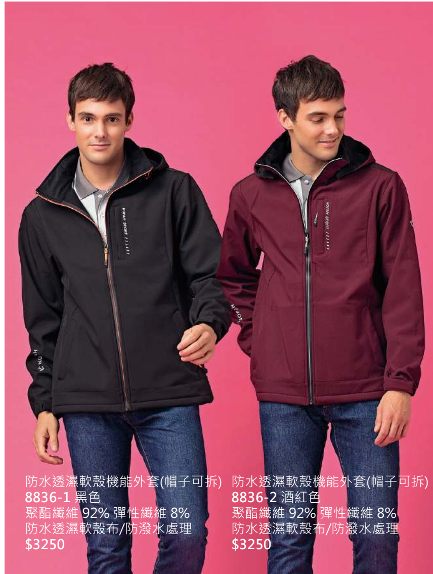
防水透濕軟殼機能外套(帽子可拆) 8836-1 黑色 聚酯纖維 92% 彈性纖維 8% 防水透濕軟殼布/防潑水處理 $3250