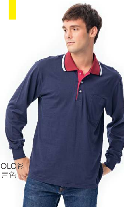
純棉長袖POLO衫 2913-2 丈青色 棉 100% $1100