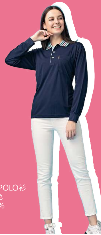
吸濕排汗長袖POLO衫 2120-2 丈青色 聚酯纖維 100% $700