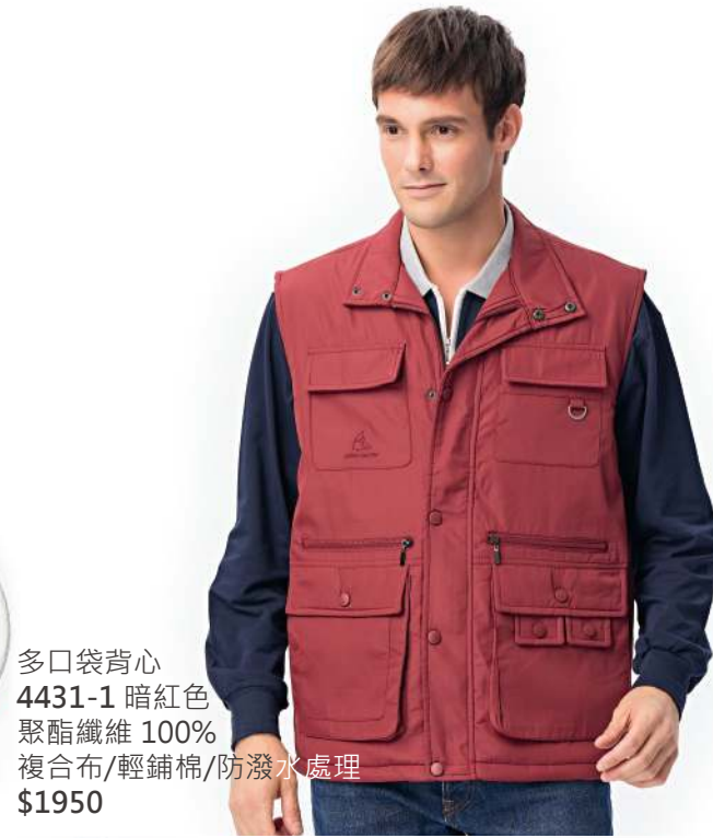
多口袋背心 4431-1 暗紅色 聚酯纖維 100% 複合布/輕鋪棉/防潑水處理 $1950