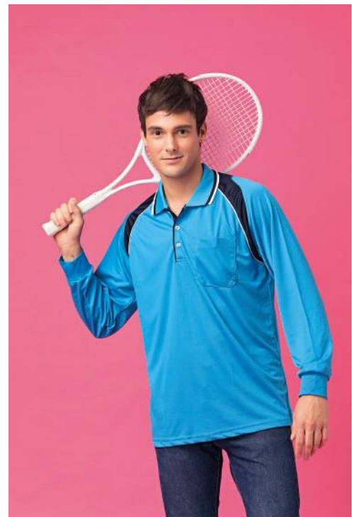
吸濕排汗長袖POLO衫 2648-1 湖水藍 聚酯纖維 100% $900