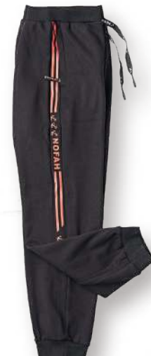
保暖針織搖粒長褲 8843-1 黑色 棉 100% $1850