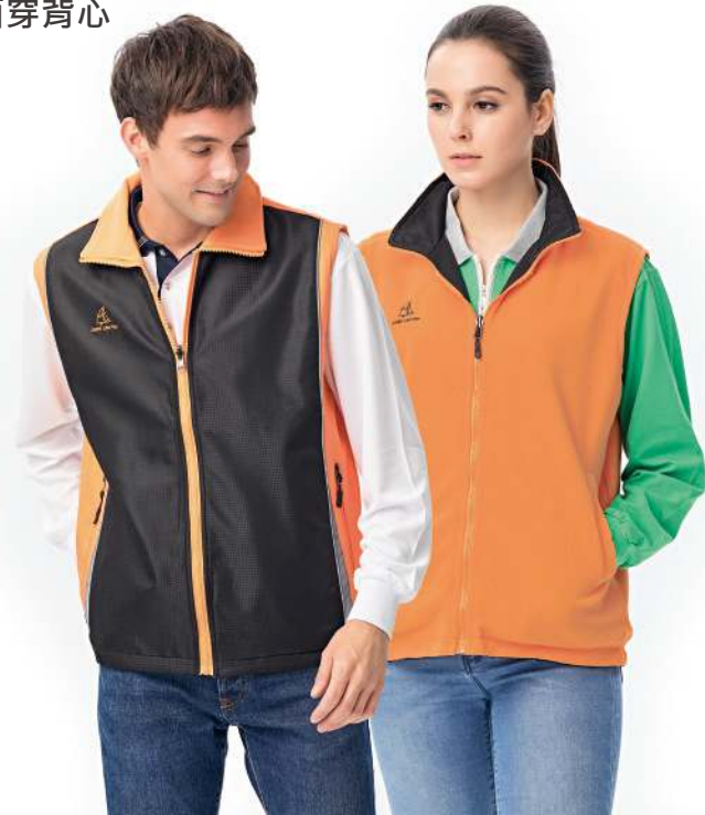
反光雙面穿搖粒背心 (可加4524-1外套) 4534-1 黑色/橘色 聚酯纖維 100% 複合布/搖粒布/防潑水處理 $1450