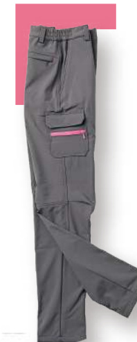
女款-高彈力機能軟殼長褲 8835-2 灰色 聚酯纖維 92% 彈性纖維 8% 防水透濕軟殼布/防潑水處理 $2450