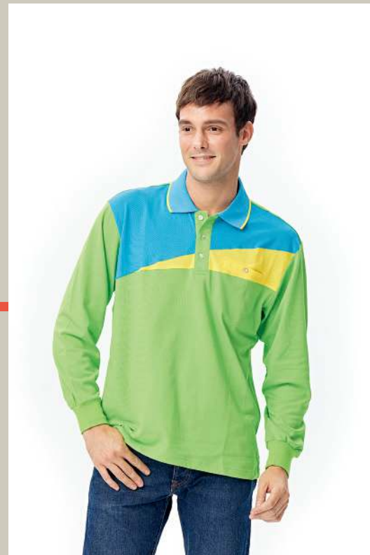
快乾棉長袖POLO衫 2542-1 芥末綠 天然棉 51.2% 聚酯纖維 48.8% 快乾棉排汗布(吸濕排汗原紗) $1300