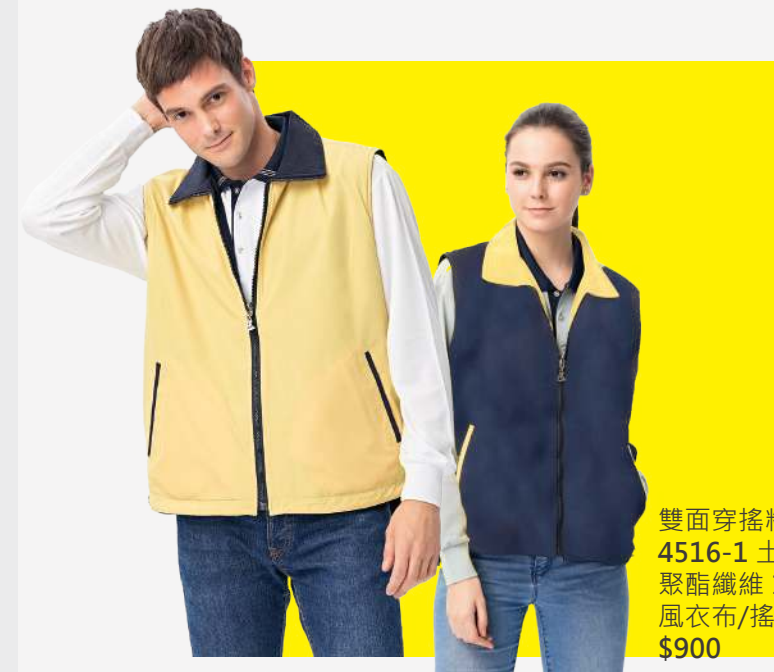
雙面穿搖粒背心 4516-1 土黃/丈青 聚酯纖維 100% 風衣布/搖粒布/防潑水處理 $900