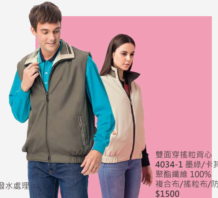
雙面穿搖粒背心 4034-1 墨綠/卡其 聚酯纖維 100% 複合布/搖粒布/防潑水處理 $1500