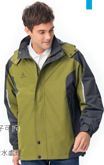
防水透濕絲光絨外套(帽子可拆) 8368-2 軍綠色 聚酯纖維 100% 防水透濕布/絲光絨/防潑水處理 $2450