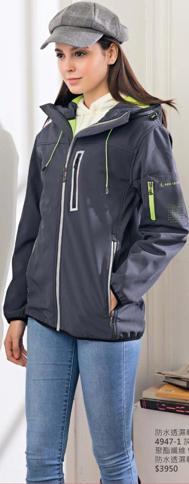
防水透濕軟殼機能外套 4947-1 灰色 聚酯纖維 92% 彈性纖維 8% 防水透濕軟殼布/防潑水處理 $3950