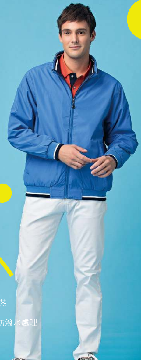
雙面穿鋪棉外套 4942-2 丈青/湖藍 聚酯纖維 100% 複合布/輕鋪棉/防潑水處理 $2300