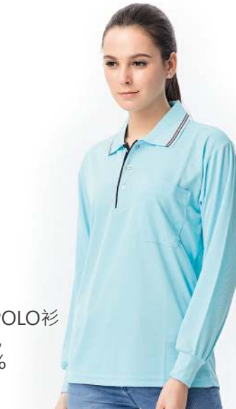
吸濕排汗長袖POLO衫 2791-3 水藍色 聚酯纖維 100% $700