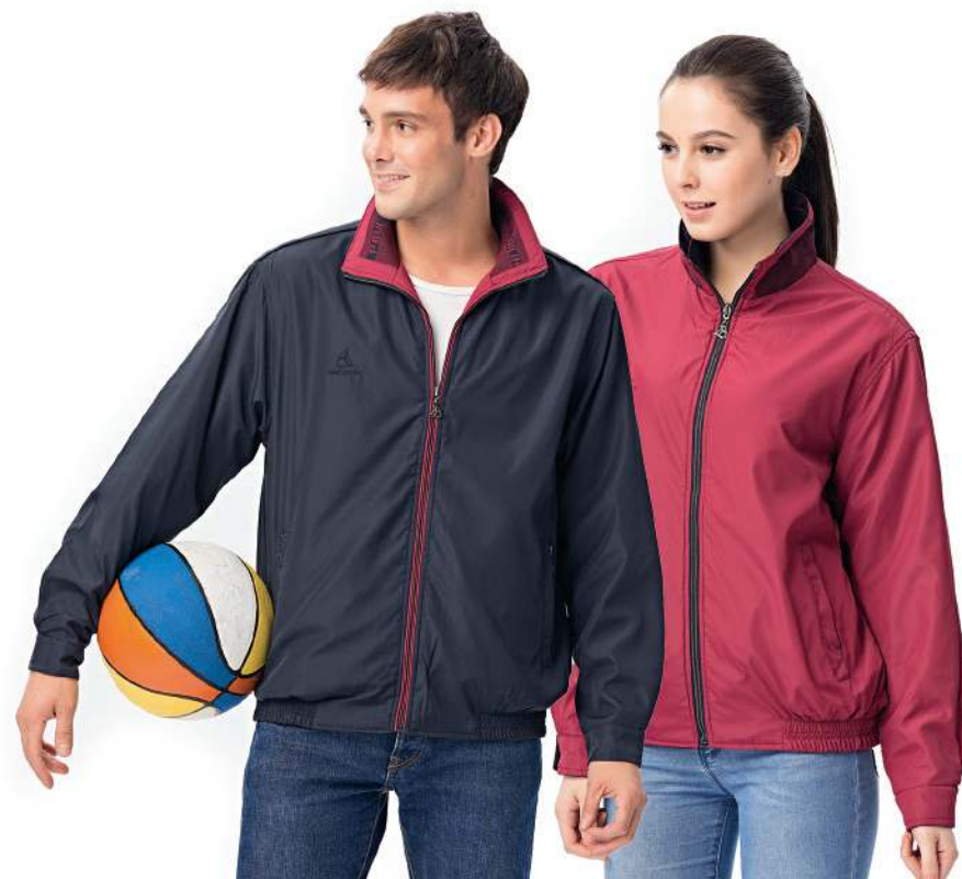
雙面穿鋪棉夾克 4145-2 丈青/酒紅 聚酯纖維 100% 複合布/輕鋪棉/防潑水處理 $2300