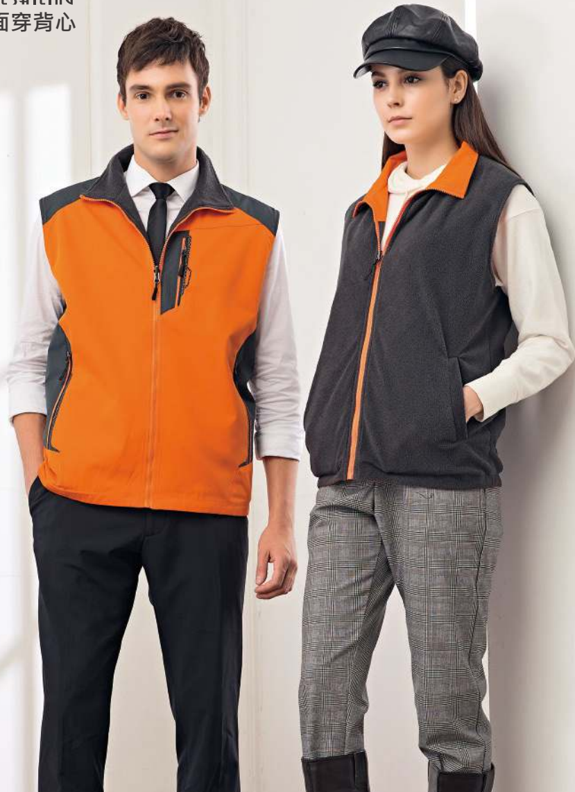
防水透濕雙面穿搖粒背心 (可加4940-2外套) 4950-2 橘色/灰色 聚酯纖維 100% 防水透濕布/搖粒布/防潑水處理 $1950