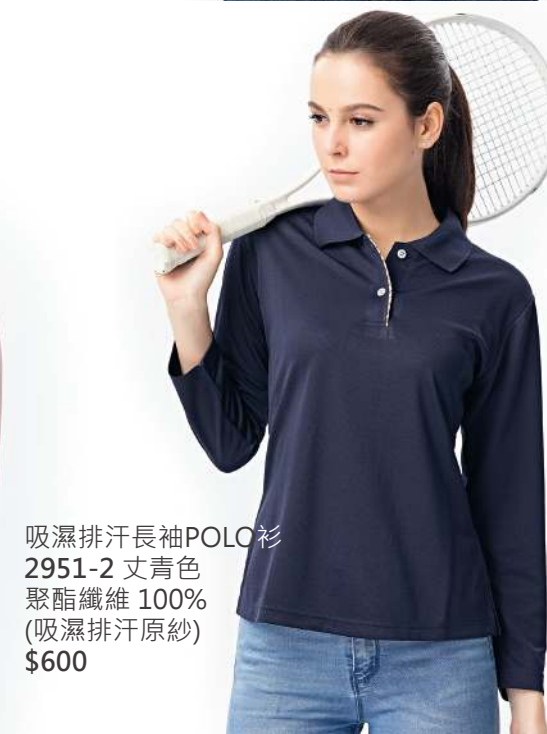
吸濕排汗長袖POLO衫 2951-2 丈青色 聚酯纖維 100% (吸濕排汗原紗) $600