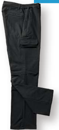
高彈力機能軟殼長褲 8834-1 黑色 聚酯纖維 92% 彈性纖維 8% 防水透濕軟殼布/防潑水處理 $2450