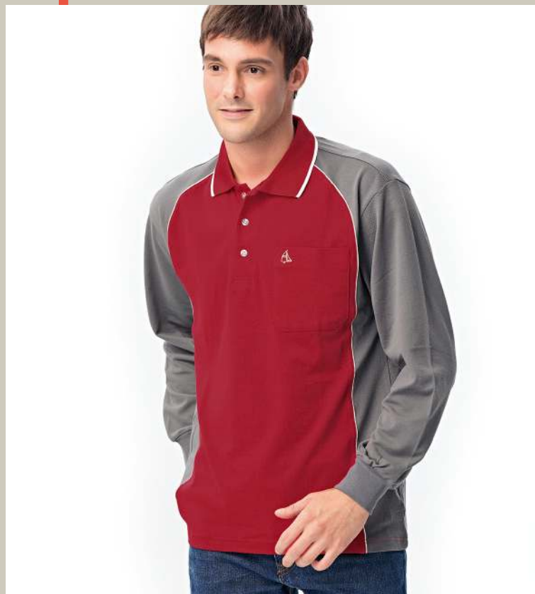
快乾棉長袖POLO衫 2349-1 紅色/灰色 天然棉 51.2% 聚酯纖維 48.8% 快乾棉排汗布(吸濕排汗原紗) $1250