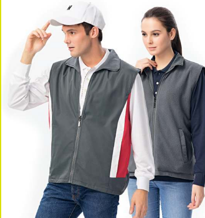
雙面穿搖粒背心 (可加4428-1外套) 4438-1 深灰色 聚酯纖維 100% 複合布/搖粒布/防潑水處理 $1400