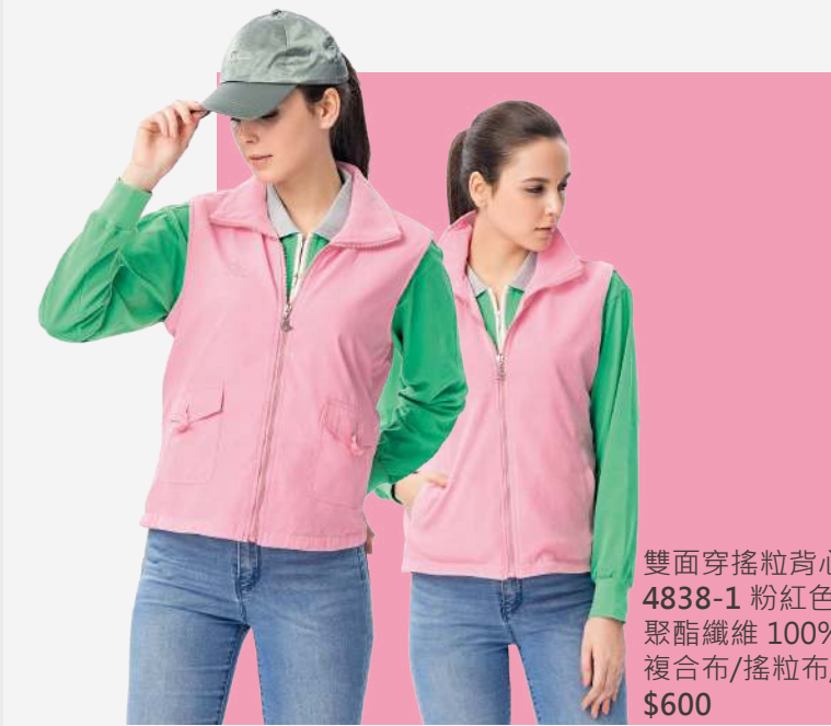
雙面穿搖粒背心 4838-1 粉紅色 聚酯纖維 100% 複合布/搖粒布/防潑水處理 $600