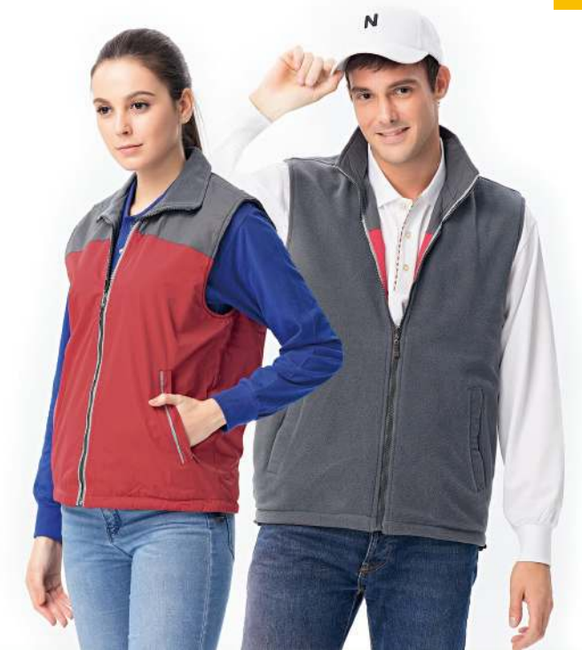
反光雙面穿搖粒背心 (可加4329-1外套) 4339-1 紅色/灰色 聚酯纖維 100% 風衣布/搖粒布/防潑水處理 $1400