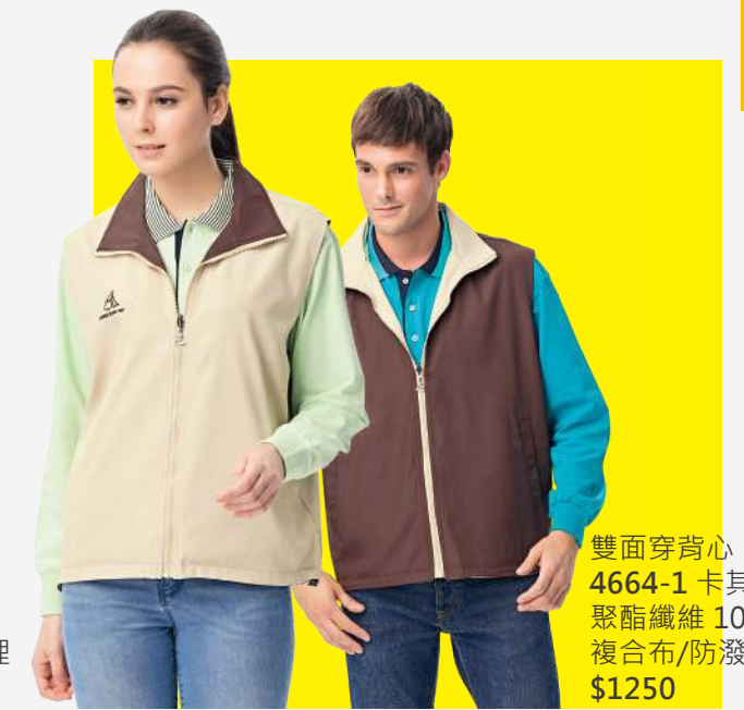
雙面穿背心 4664-1 卡其/咖啡 聚酯纖維 100% 複合布/防潑水處理 $1250