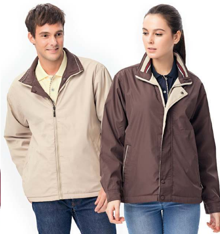
雙面穿鋪棉外套 4249-1 咖啡/卡其 聚酯纖維 100% 複合布/輕鋪棉/防潑水處理 $1800