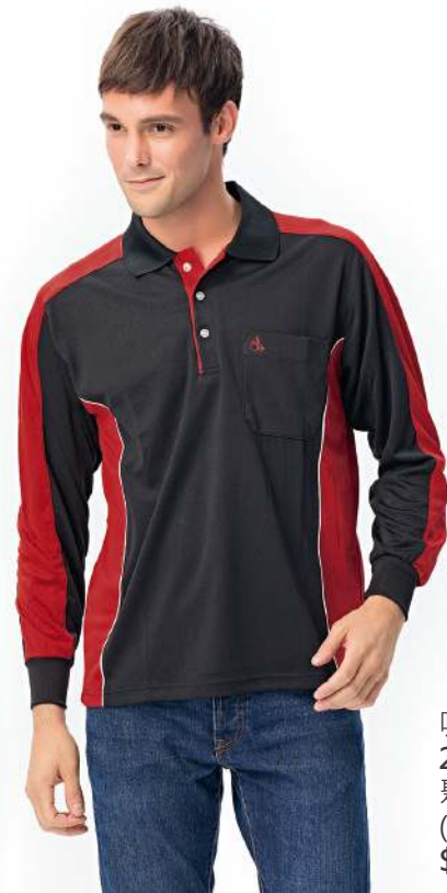
吸濕排汗長袖POLO衫 2439-2 黑色 聚酯纖維 100% (吸濕排汗原紗) $1250