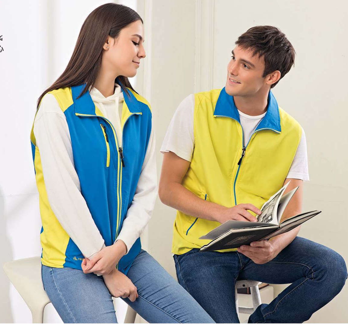
雙面穿背心 4970-5 海藍/黃色 聚酯纖維 100% $1300