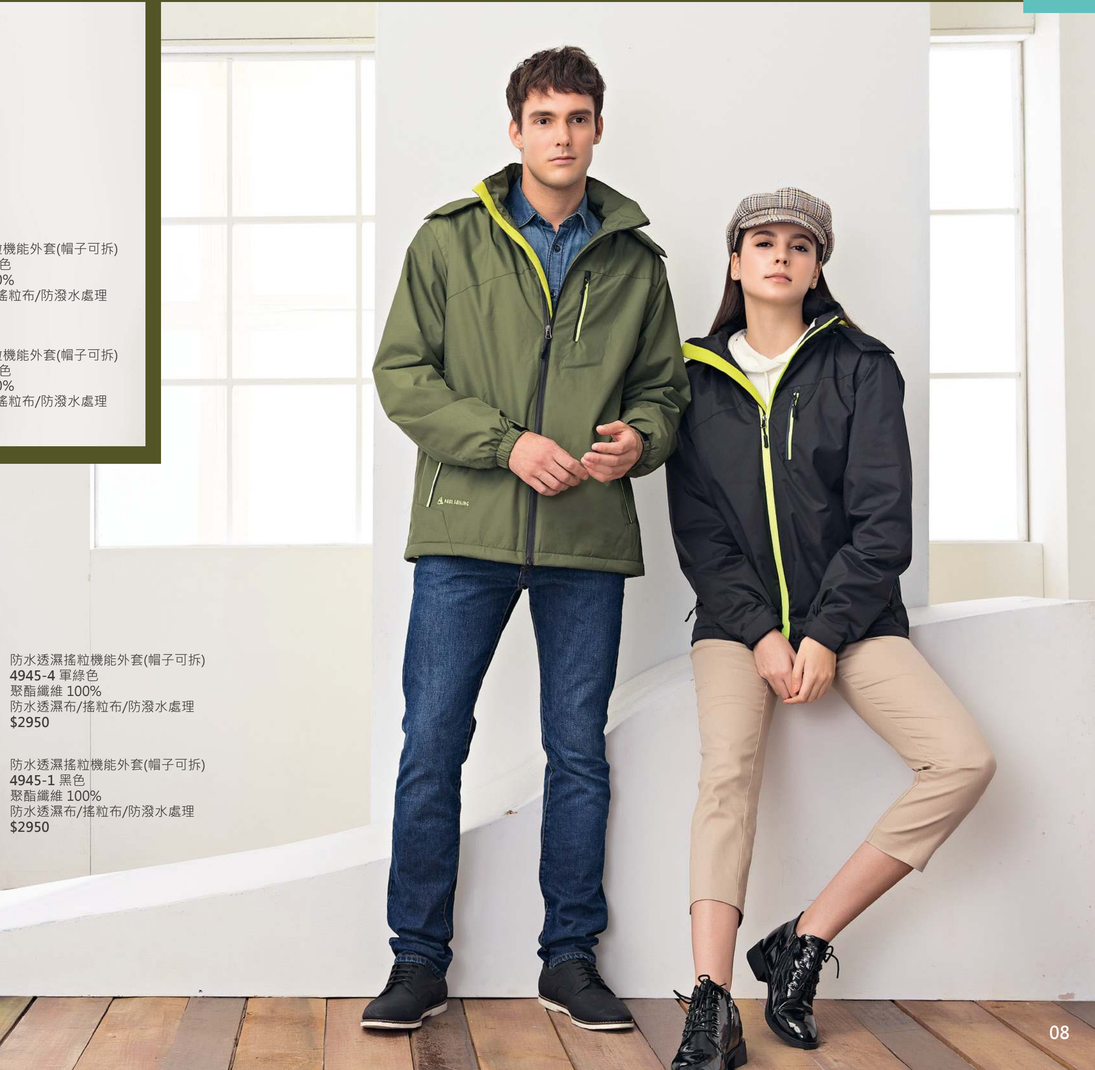
防水透濕搖粒機能外套(帽子可拆) 4945-4 軍綠色 聚酯纖維 100% 防水透濕布/搖粒布/防潑水處理 $2950