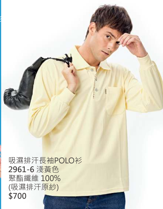
吸濕排汗長袖POLO衫 2961-6 淺黃色 聚酯纖維 100% (吸濕排汗原紗) $700