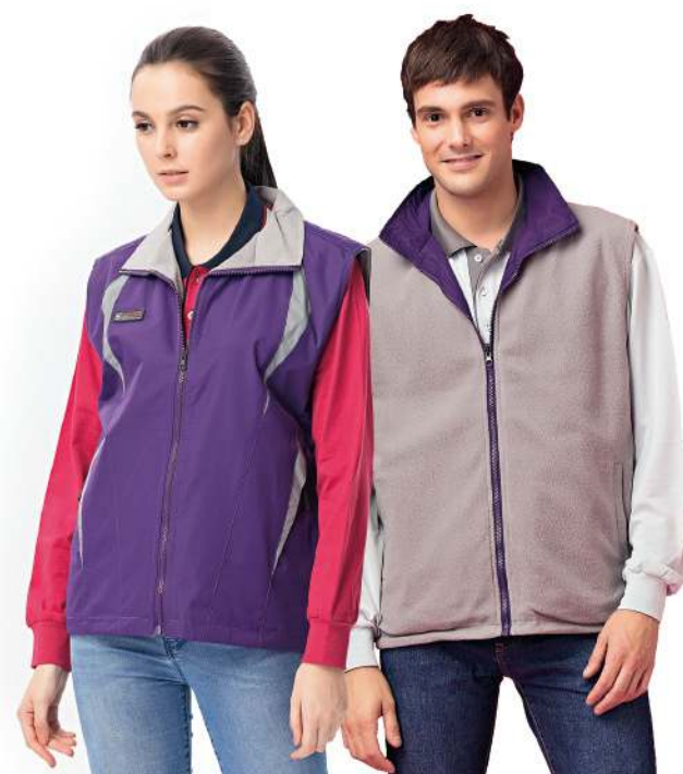
防水反光雙面穿搖粒背心 (可加4522-1外套) 4532-1 紫色/灰色 聚酯纖維 100% 風衣布/搖粒布/防潑水處理 $1450