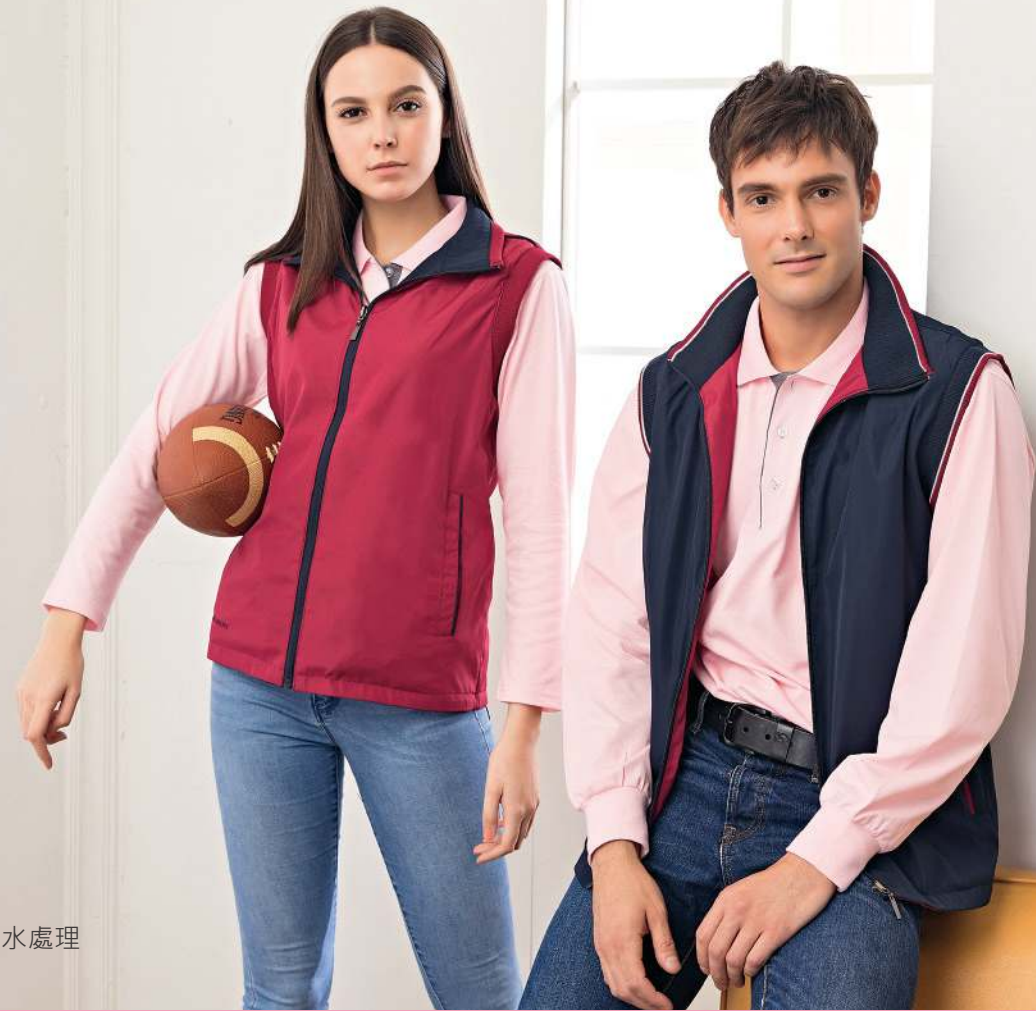
雙面穿鋪棉背心 4958-2 丈青/紅色 聚酯纖維 100% 複合布/輕鋪棉/防潑水處理 $1750