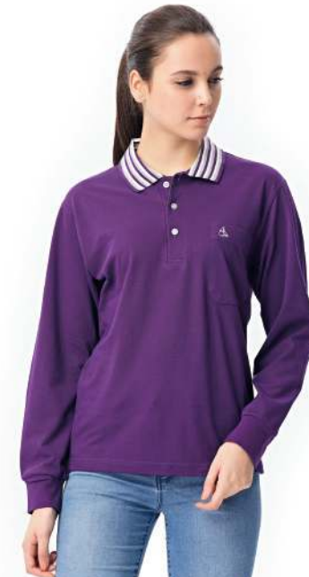
快乾棉長袖POLO衫 2124-3 紫色 天然棉 51.2% 聚酯纖維 48.8% 快乾棉排汗布(吸濕排汗原紗) $1250