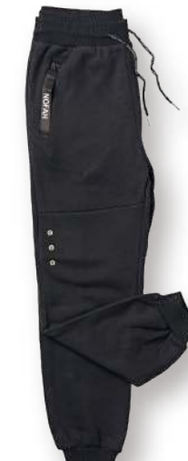
女款-保暖針織搖粒長褲 8724-1 黑色 棉 100% $1850