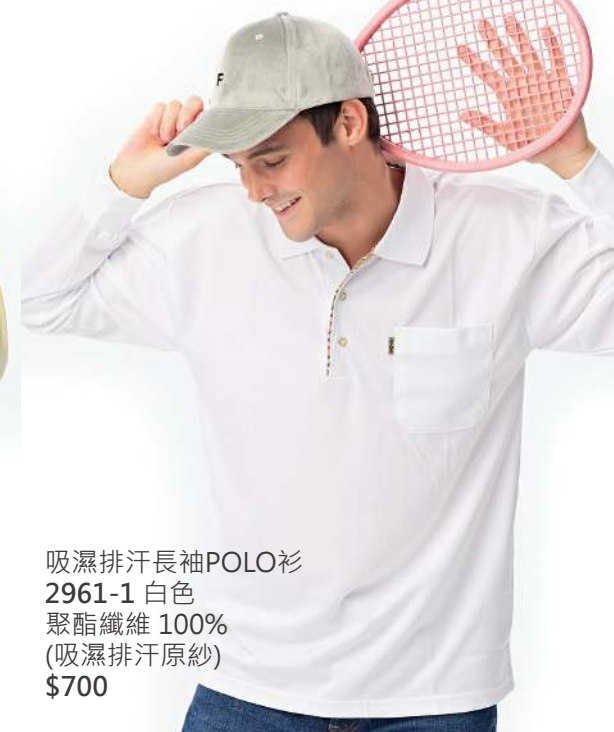
吸濕排汗長袖POLO衫 2961-1 白色 聚酯纖維 100% (吸濕排汗原紗) $700