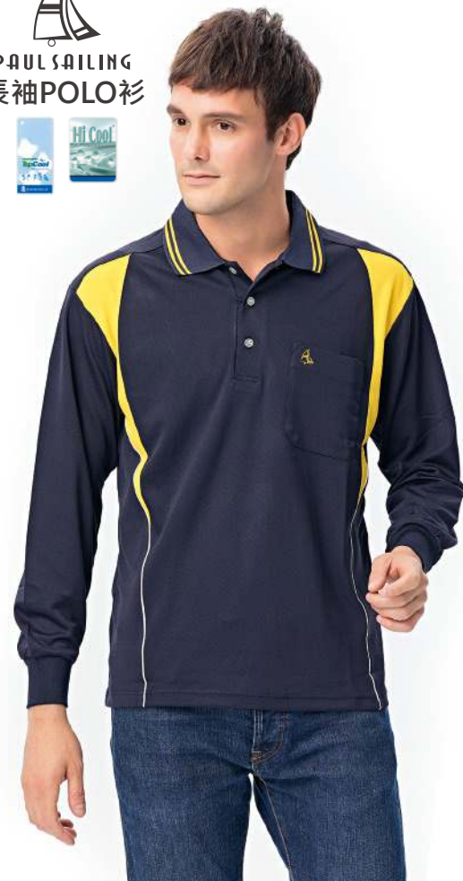
吸濕排汗長袖POLO衫 2241-1 丈青/黃色 聚酯纖維 100% (吸濕排汗原紗) $1250