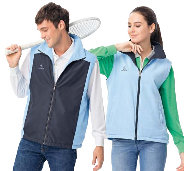
雙面穿搖粒背心 4338-1 丈青/水藍 聚酯纖維 100% 複合布/搖粒布/防潑水處理 $1150