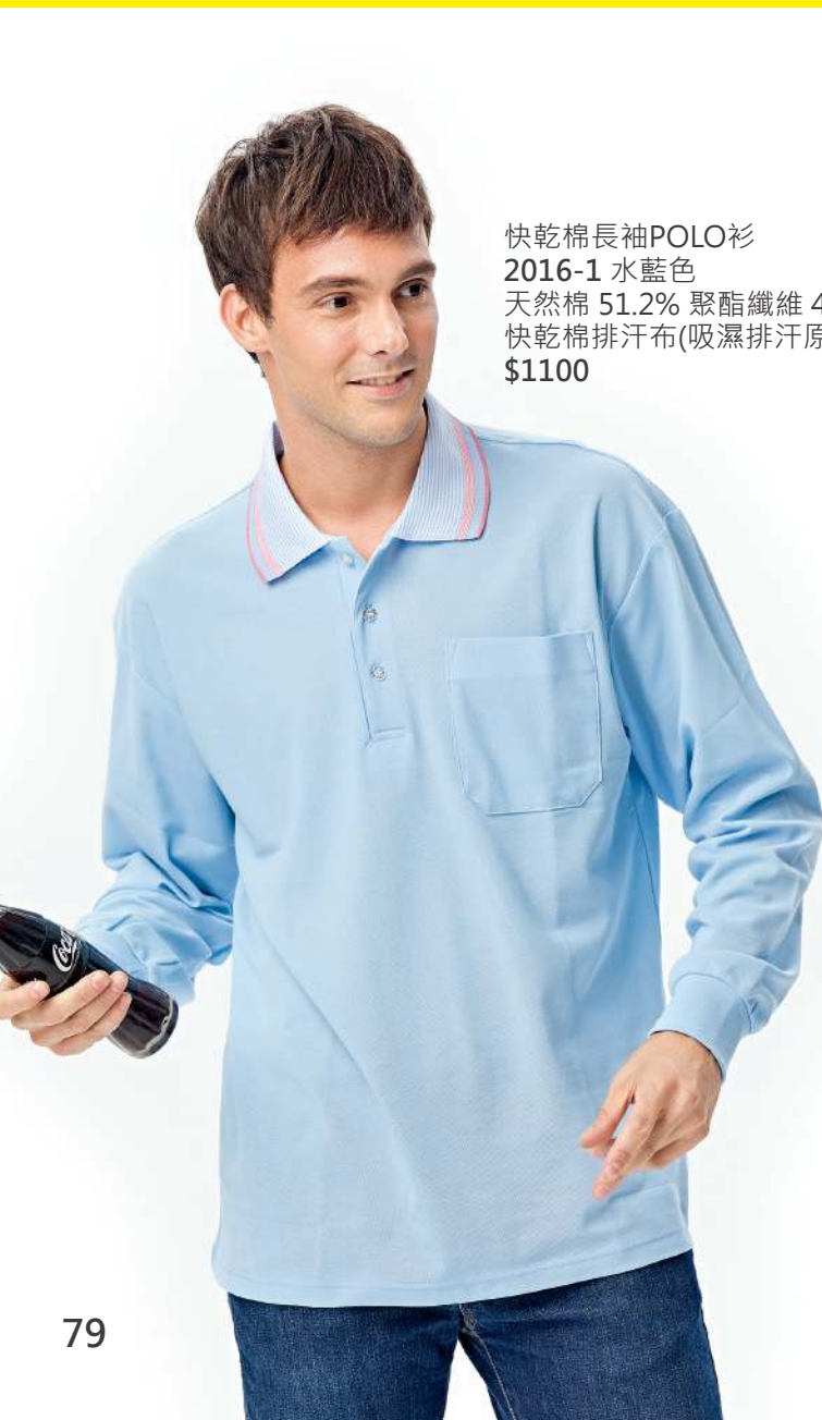
快乾棉長袖POLO衫 2016-1 水藍色 天然棉 51.2% 聚酯纖維 48.8% 快乾棉排汗布(吸濕排汗原紗) $1100