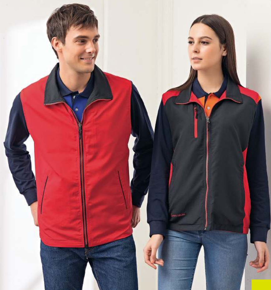
雙面穿背心 4970-2 黑色/大紅 聚酯纖維 100% $1300