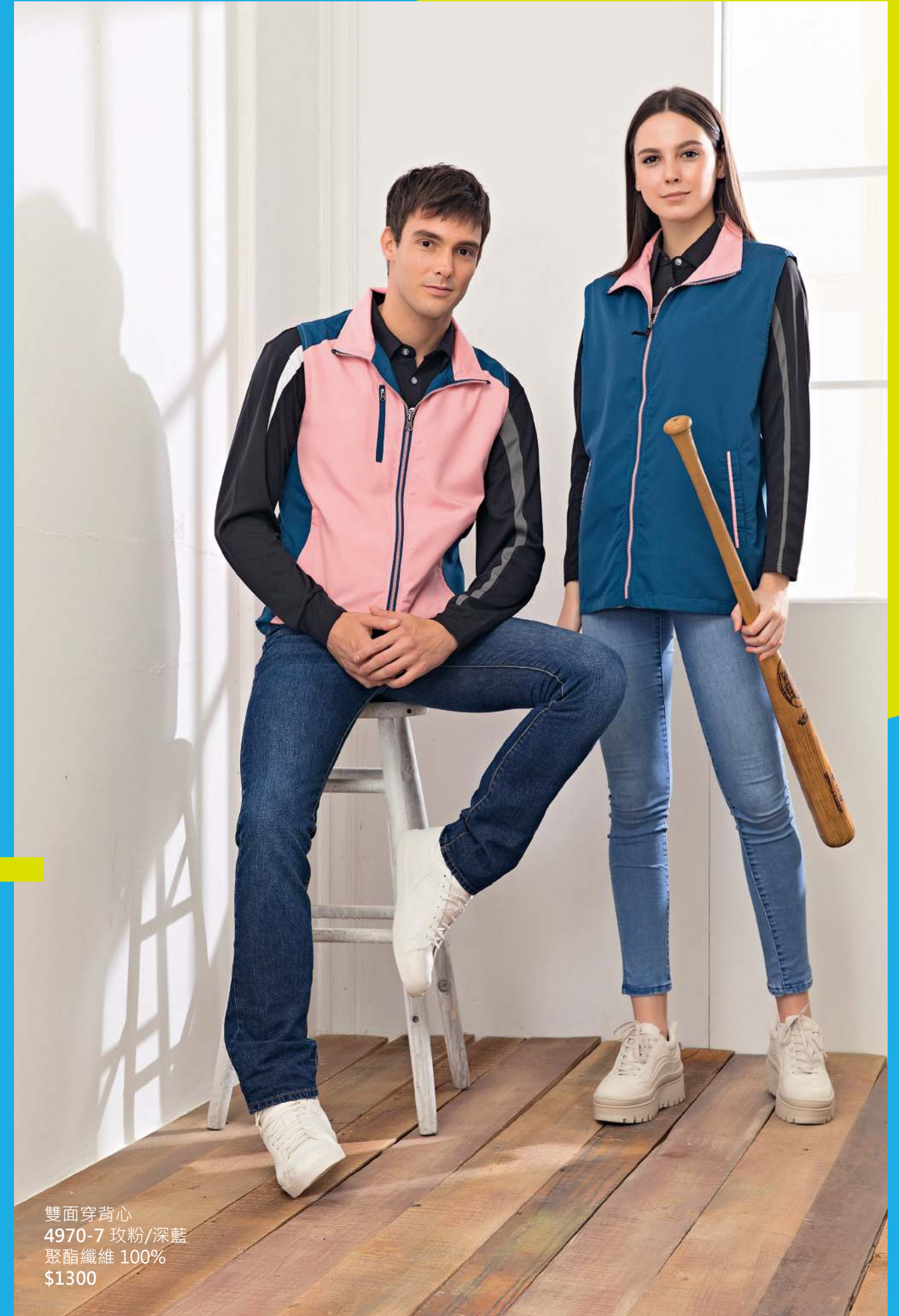
雙面穿背心 4970-7 玫粉/深藍 聚酯纖維 100% $1300