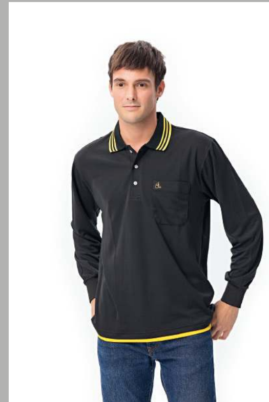
吸濕排汗長袖POLO衫 2131-2 黑色 聚酯纖維 100% (吸濕排汗原紗) $1250