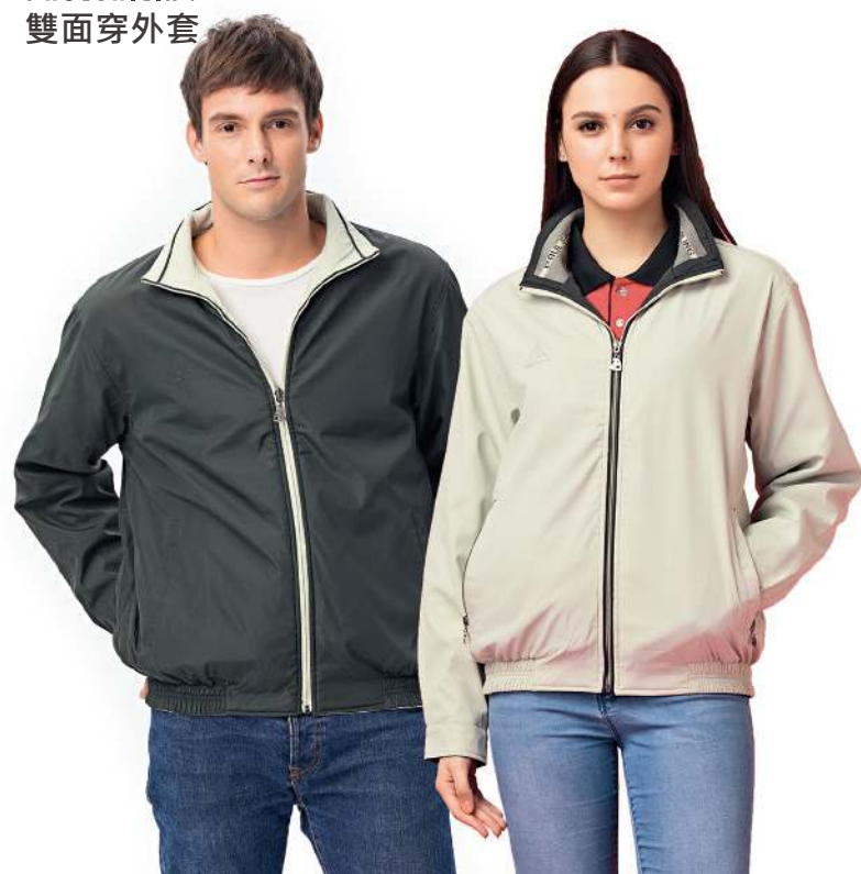
雙面穿鋪棉夾克 4145-1 淡綠/灰綠 聚酯纖維 100% 複合布/輕鋪棉/防潑水處理 $2300