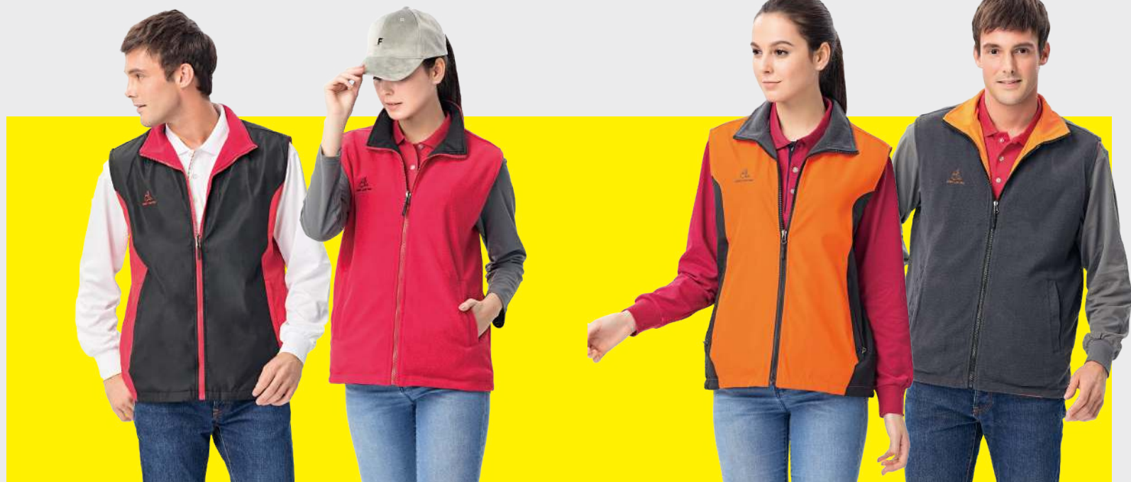
雙面穿搖粒背心 4337-3 黑色/紅色 聚酯纖維 100% 複合布/搖粒布/防潑水處理 $1450