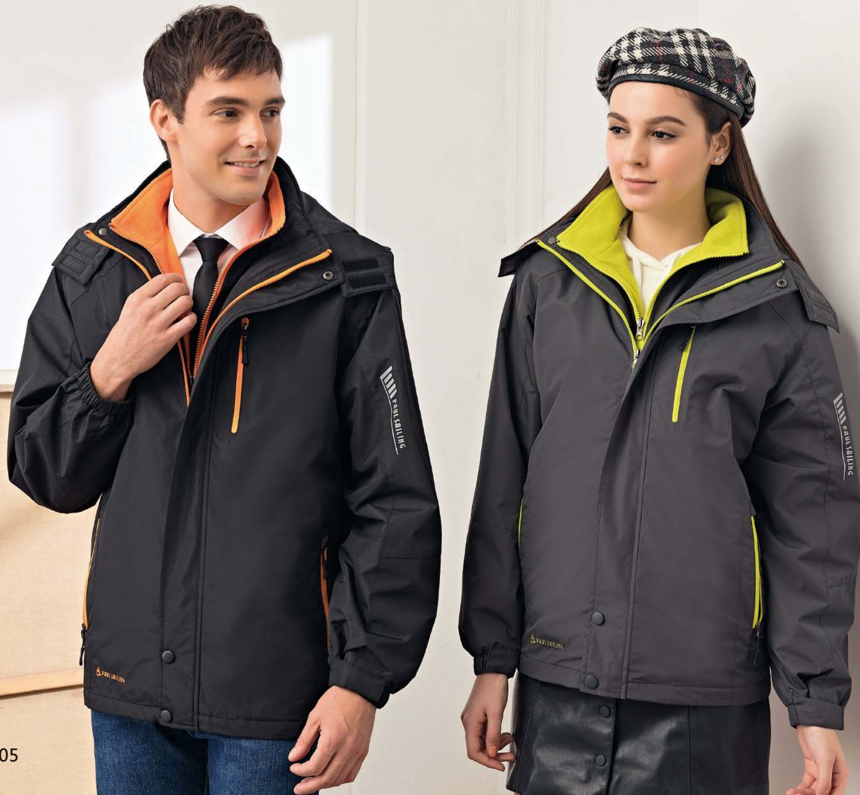
防水透濕鋪棉機能外套(帽子可拆) (可加背心) 4941-2 黑色 聚酯纖維 100% 防水透濕布/輕鋪棉/防潑水處理 $2950