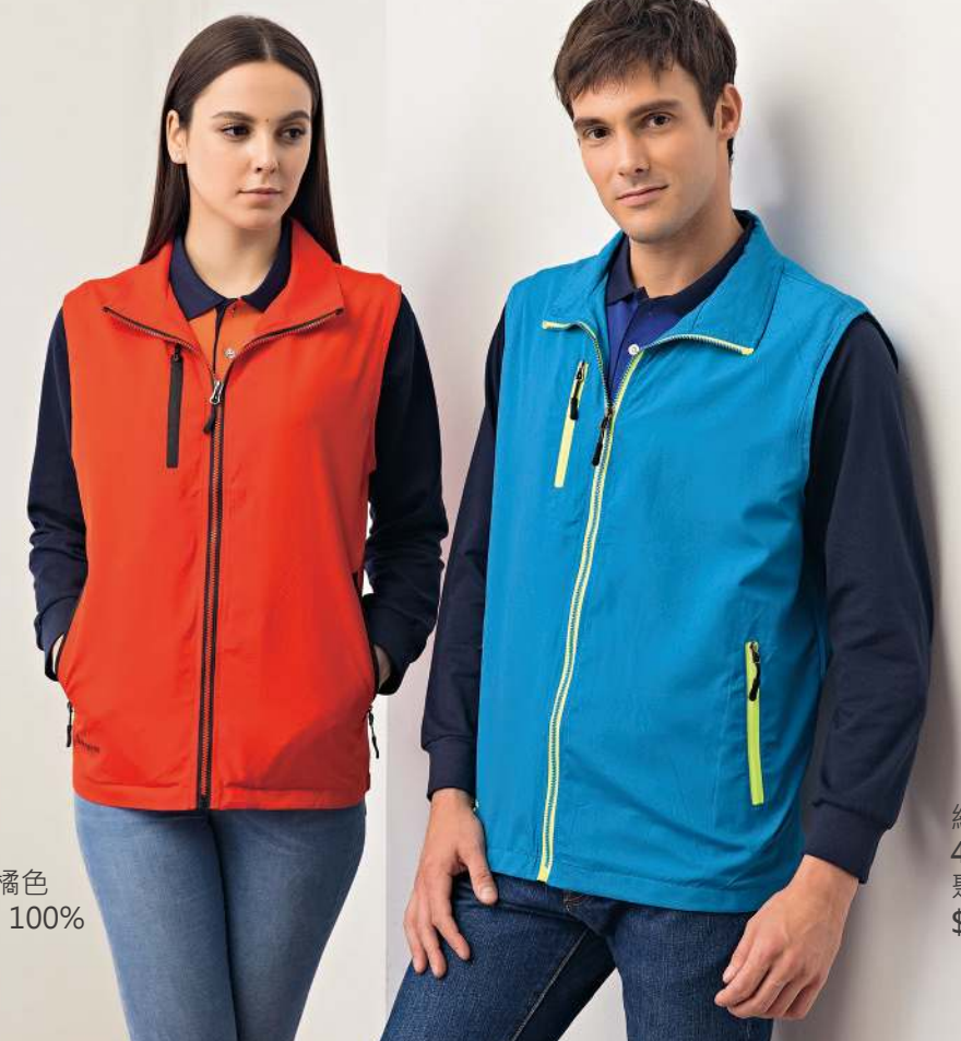
網裡背心 4971-1 海藍色 聚酯纖維 100% $1100