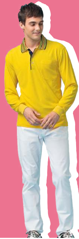
吸濕排汗長袖POLO衫 2120-4 黃色 聚酯纖維 100% $700