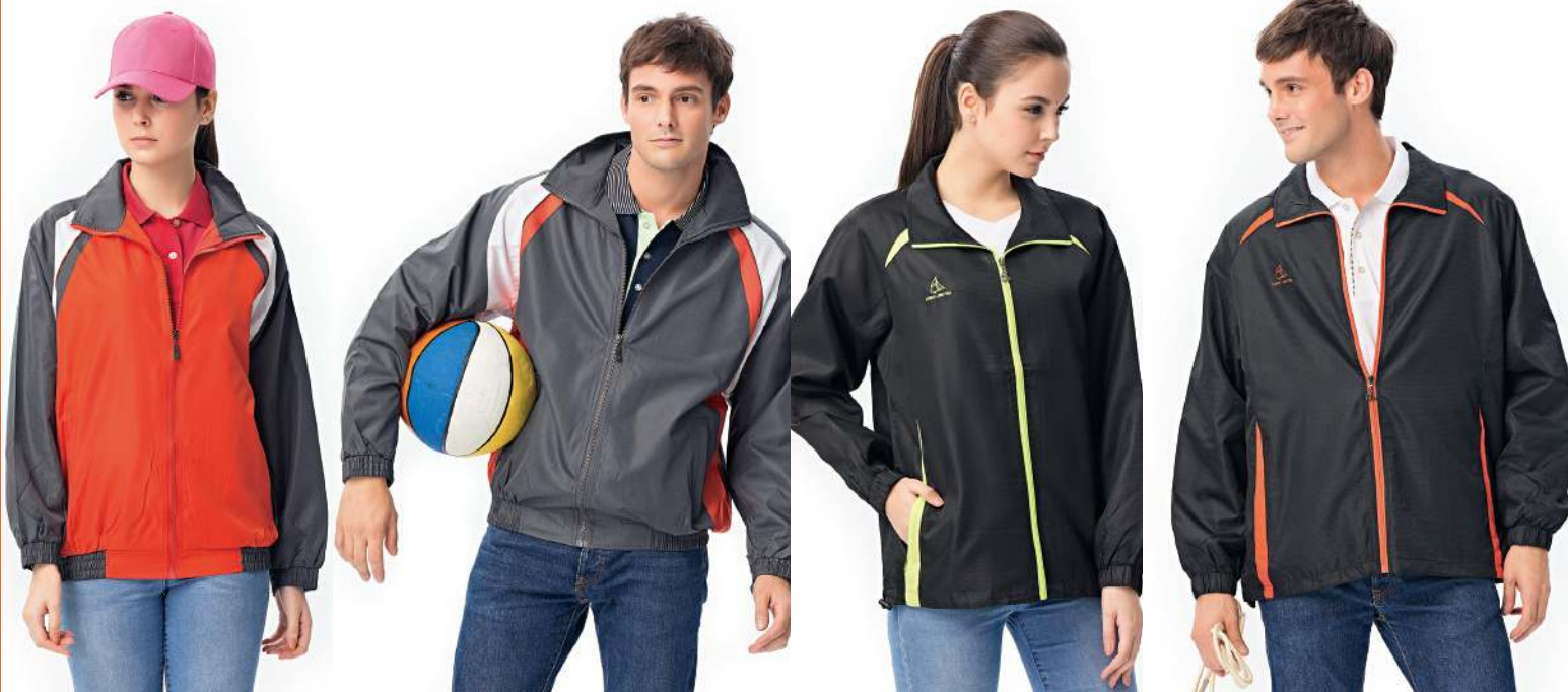
風衣外套 4049-1 橘色 聚酯纖維 100% 防潑水處理 $1500