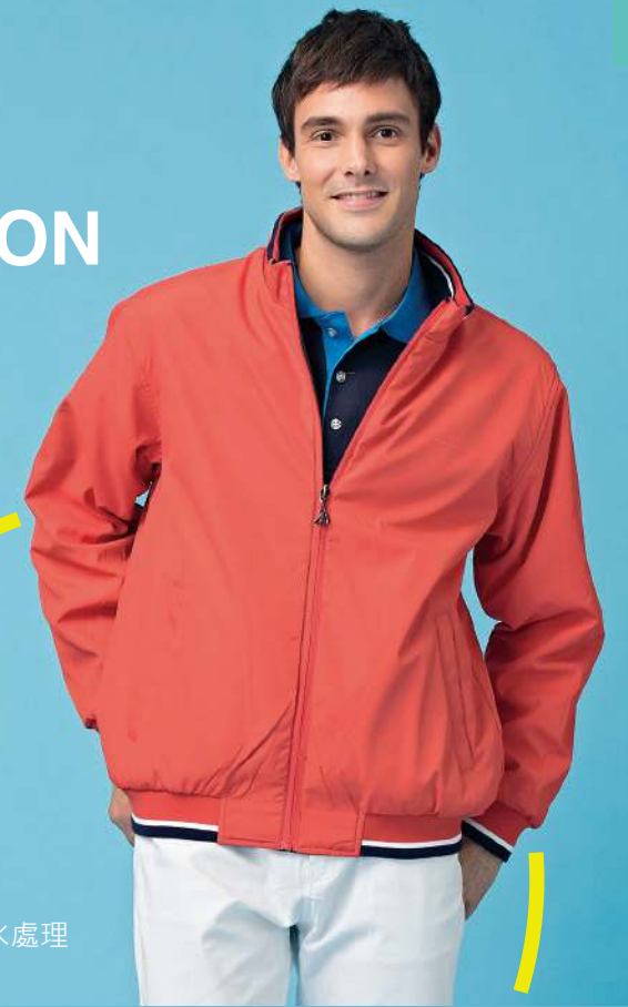
雙面穿鋪棉外套 4942-1 丈青/橘色 聚酯纖維 100% 複合布/輕鋪棉/防潑水處理 $2300