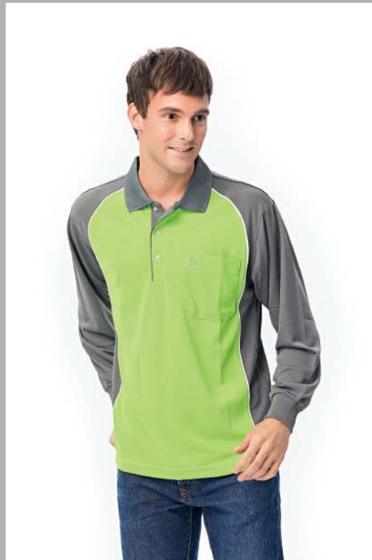
吸濕排汗長袖POLO衫 2342-1 芥綠/灰色 聚酯纖維 100% (吸濕排汗原紗) $1250