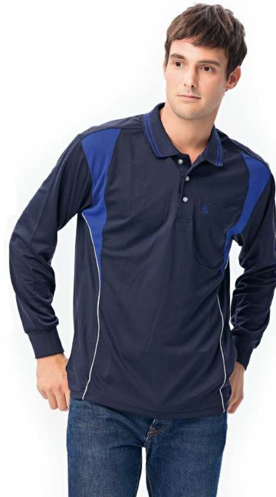
吸濕排汗長袖POLO衫 2241-3 丈青/寶藍 聚酯纖維 100% (吸濕排汗原紗) $1250