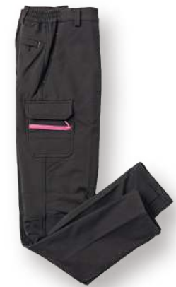
女款-高彈力機能軟殼長褲 8835-1 黑色 聚酯纖維 92% 彈性纖維 8% 防水透濕軟殼布/防潑水處理 $2450