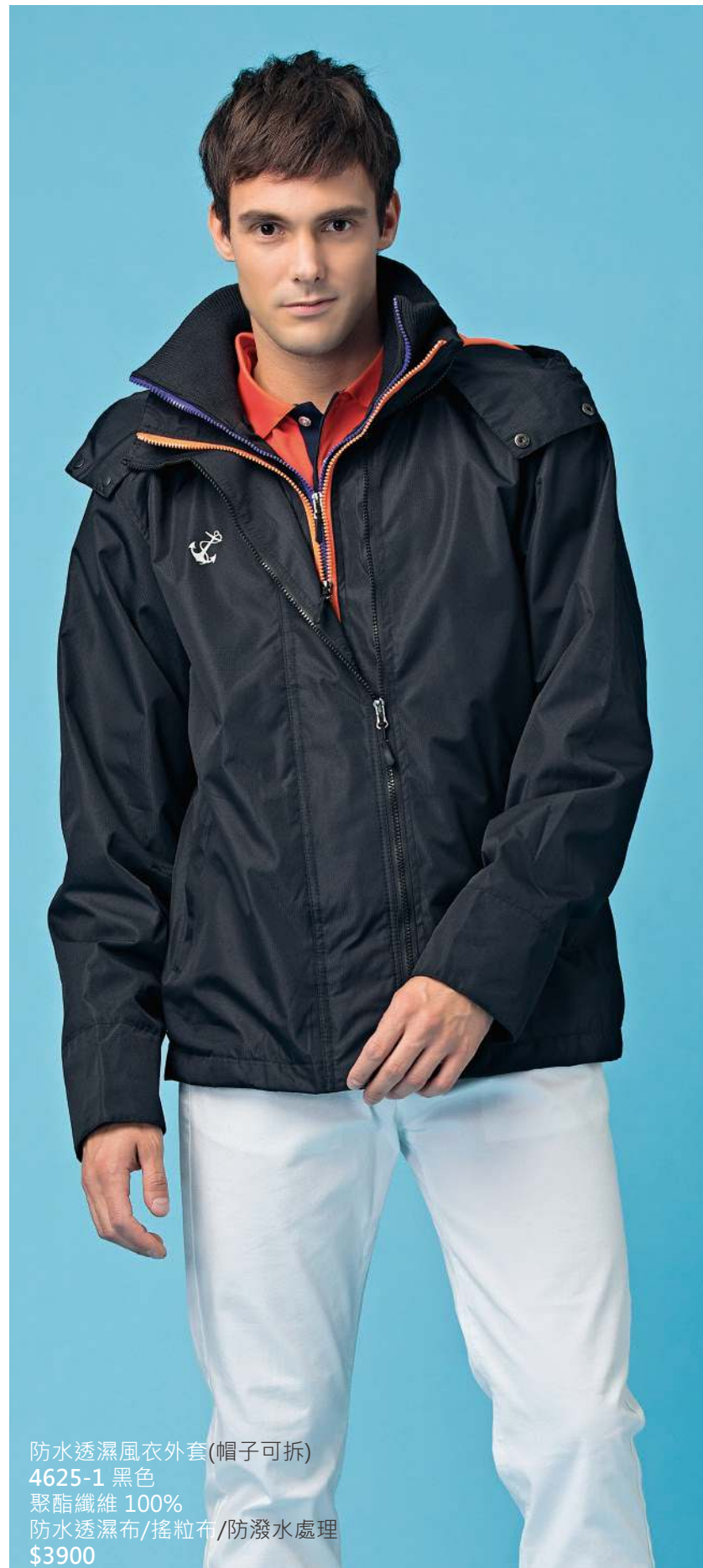
防水透濕風衣外套(帽子可拆) 4625-1 黑色 聚酯纖維 100% 防水透濕布/搖粒布/防潑水處理 $3900