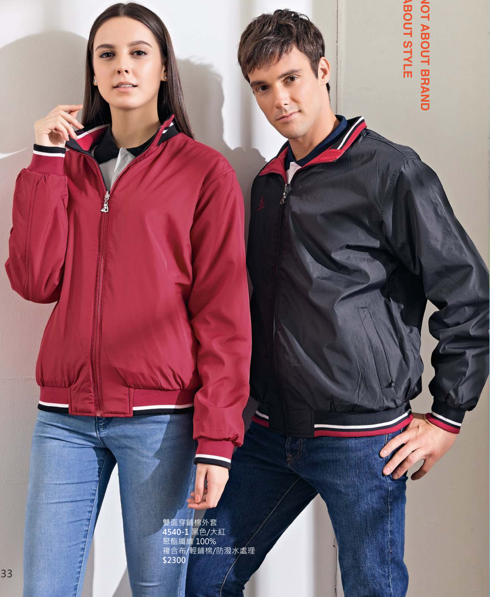
雙面穿鋪棉外套 4540-1 黑色/大紅 聚酯纖維 100% 複合布/輕鋪棉/防潑水處理 $2300