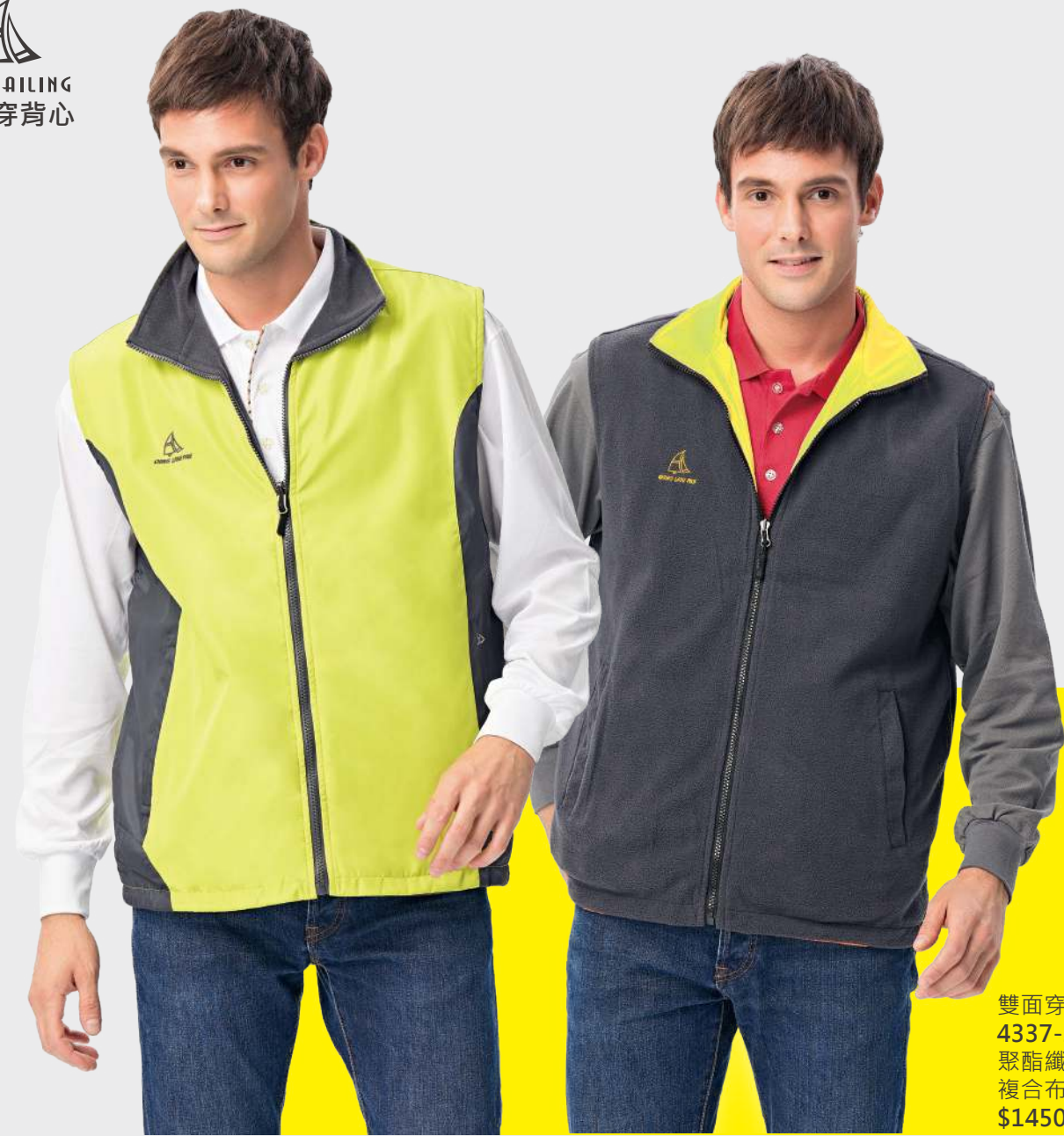
雙面穿搖粒背心 4337-2 芥綠/灰色 聚酯纖維 100% 複合布/搖粒布/防潑水處理 $1450