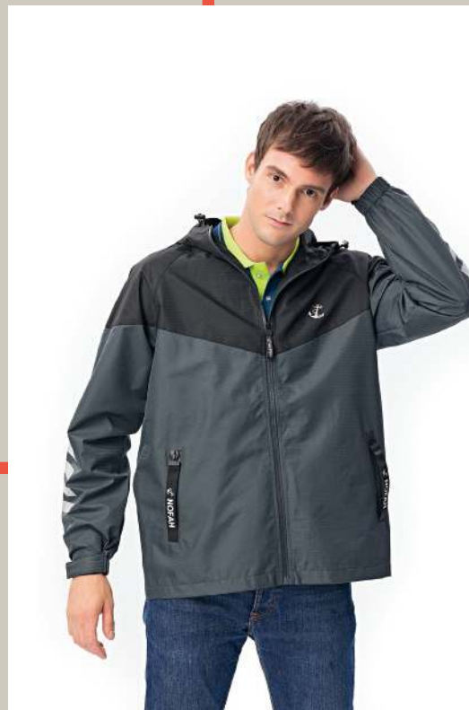
防水透濕反光機能外套 8831-1 灰色 聚酯纖維 100% 防水透濕布/網裡布/防潑水處理 $1950