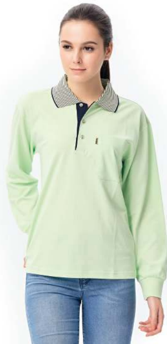
快乾棉長袖POLO衫 2011-1 淺綠色 天然棉 51.2% 聚酯纖維 48.8% 快乾棉排汗布(吸濕排汗原紗) $1100