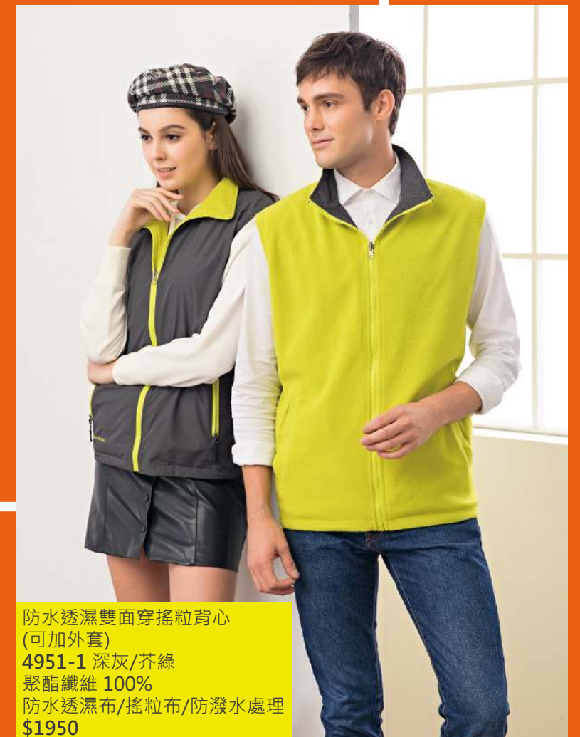
防水透濕雙面穿搖粒背心 (可加外套) 4951-1 深灰/芥綠 聚酯纖維 100% 防水透濕布/搖粒布/防潑水處理 $1950