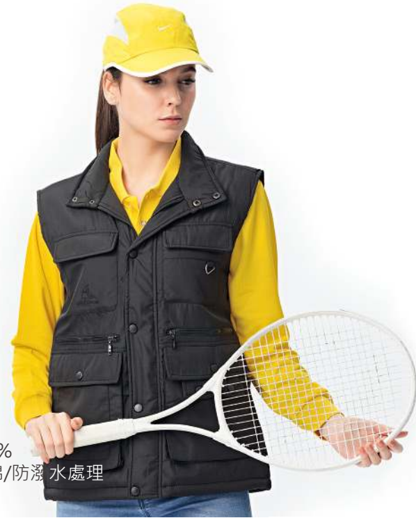
多口袋背心 4431-2 黑色 聚酯纖維 100% 複合布/輕鋪棉/防潑水處理 $1950