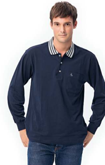
快乾棉長袖POLO衫 2124-2 丈青色 天然棉 51.2% 聚酯纖維 48.8% 快乾棉排汗布(吸濕排汗原紗) $1250