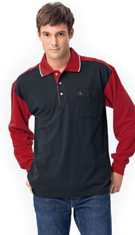
快乾棉長袖POLO衫 2248-2 黑色 天然棉 51.2% 聚酯纖維 48.8% 快乾棉排汗布(吸濕排汗原紗) $1300