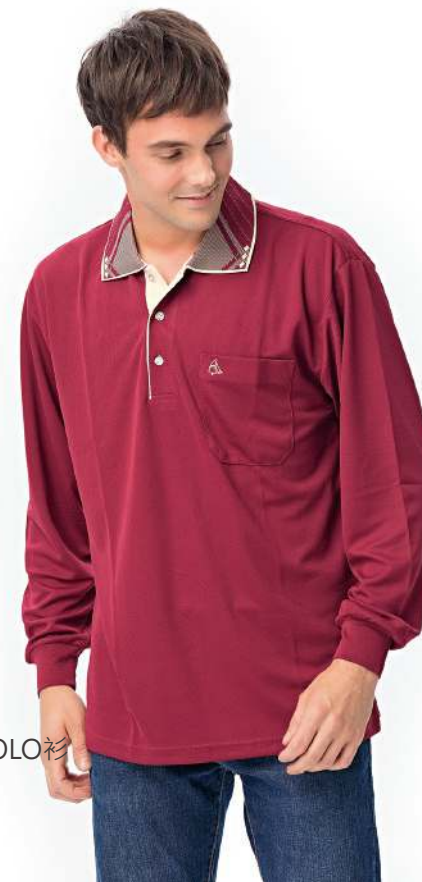
吸濕排汗長袖POLO衫 2811-3 暗紅色 聚酯纖維 100% (吸濕排汗原紗) $1250