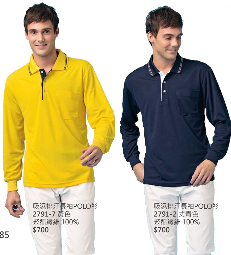
吸濕排汗長袖POLO衫 2791-7 黃色 聚酯纖維 100% $700 吸濕排汗長袖POLO衫 2791-2 丈青色 聚酯纖維 100% $700