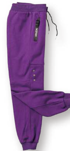
女款-保暖針織搖粒長褲 8724-2 紫色 棉 100% $1850