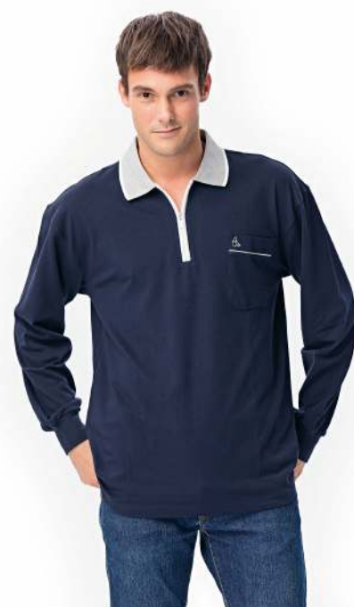
快乾棉長袖POLO衫 2541-2 丈青色 天然棉 51.2% 聚酯纖維 48.8% 快乾棉排汗布(吸濕排汗原紗) $1250