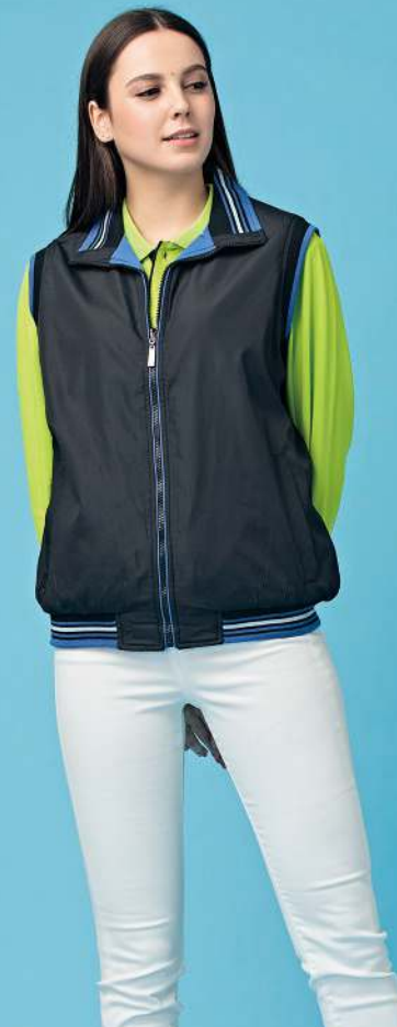
雙面穿鋪棉背心 4134-2 黑色/寶藍 聚酯纖維 100% 複合布/輕鋪棉/防潑水處理 $1500