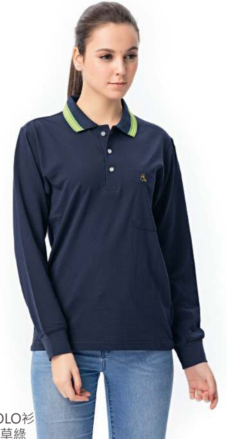
快乾棉長袖POLO衫 2437-1 丈青/草綠 天然棉 51.2% 聚酯纖維 48.8% 快乾棉排汗布(吸濕排汗原紗) $1250