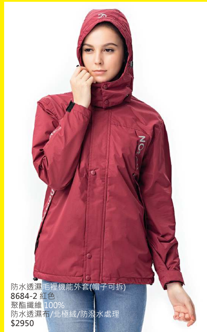
防水透濕毛裡機能外套(帽子可拆) 8684-2 紅色 聚酯纖維 100% 防水透濕布/北極絨/防潑水處理 $2950