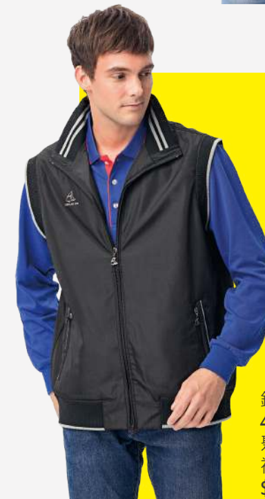
鋪棉背心 4633-1 黑色 聚酯纖維 100% 複合布/輕鋪棉/防潑水處理 $1750