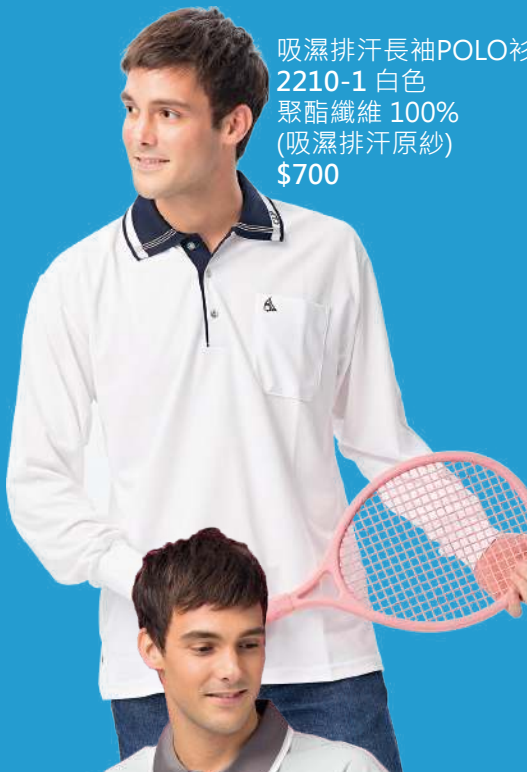
吸濕排汗長袖POLO衫 2210-1 白色 聚酯纖維 100% (吸濕排汗原紗) $700