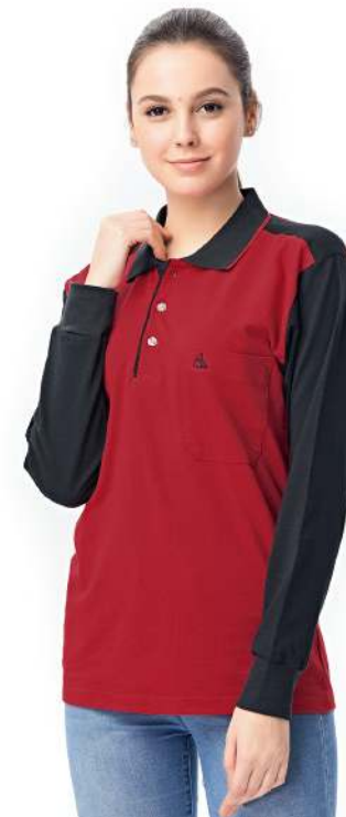
快乾棉長袖POLO衫 2248-1 紅色 天然棉 51.2% 聚酯纖維 48.8% 快乾棉排汗布(吸濕排汗原紗) $1300