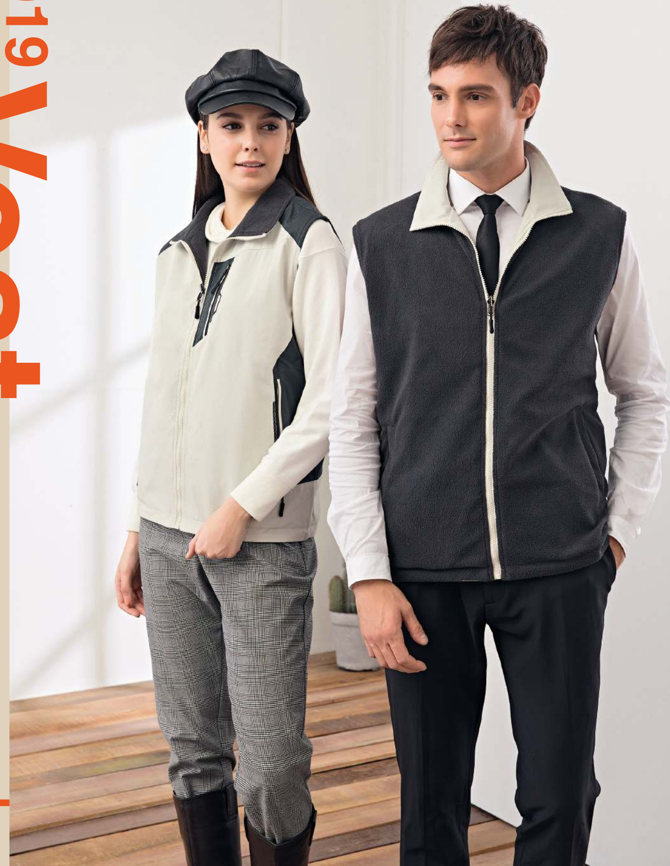
防水透濕雙面穿搖粒背心 (可加4940-1外套) 4950-1 珍珠白/灰 聚酯纖維 100% 防水透濕布/搖粒布/防潑水處理 $1950