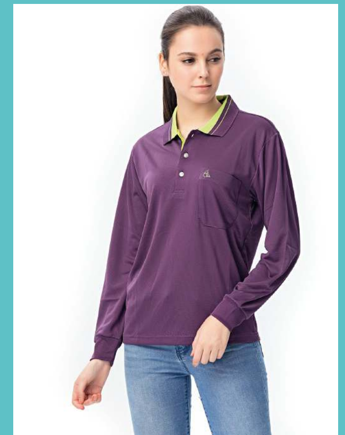
吸濕排汗長袖POLO衫 2436-1 紫色 聚酯纖維 100% (吸濕排汗原紗) $1250