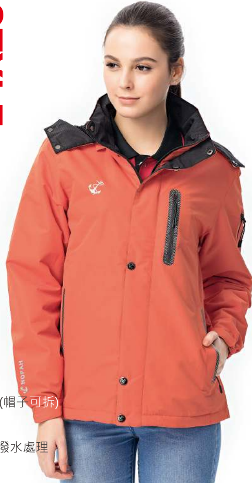
防水透濕毛裡機能外套(帽子可拆) 8837-2 橘色 聚酯纖維 100% 防水透濕布/北極絨/防潑水處理 $3250