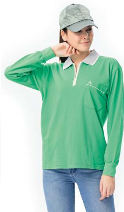
快乾棉長袖POLO衫 2541-1 翠綠色 天然棉 51.2% 聚酯纖維 48.8% 快乾棉排汗布(吸濕排汗原紗) $1000