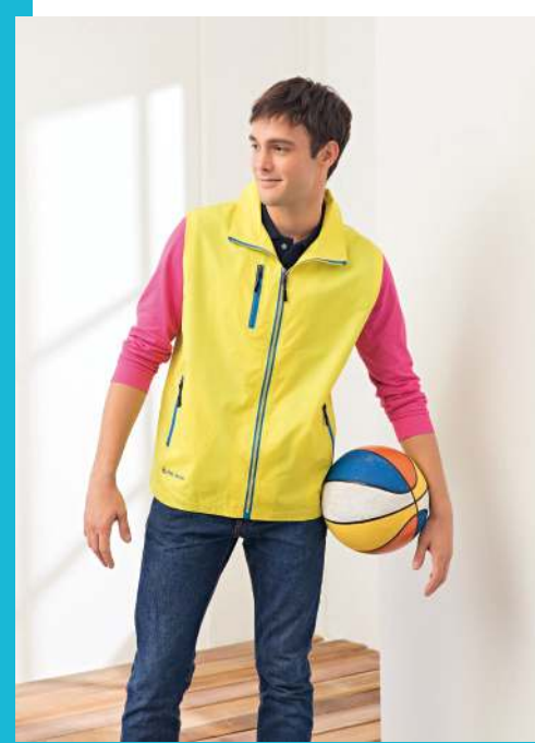
網裡背心 4971-5 亮黃色 聚酯纖維 100% $1100