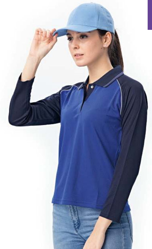
女款-吸濕排汗長袖POLO衫 2882-3 寶藍色 聚酯纖維 100% (吸濕排汗原紗) $1200