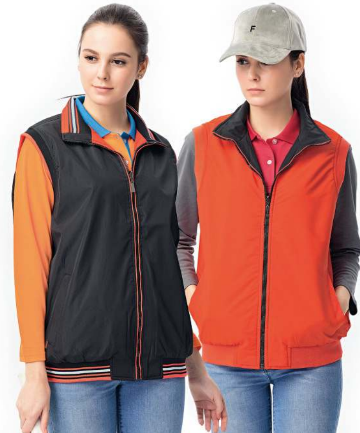
雙面穿鋪棉背心 4134-1 黑色/橘色 聚酯纖維 100% 複合布/輕鋪棉/防潑水處理 $1500