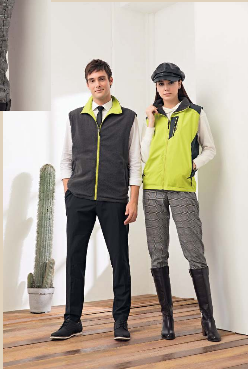
防水透濕雙面穿搖粒背心 (可加4940-3外套) 4950-3 芥綠/灰色 聚酯纖維 100% 防水透濕布/搖粒布/防潑水處理 $1950