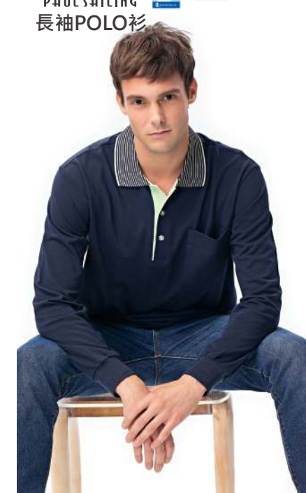
快乾棉長袖POLO衫 2011-2 丈青色 天然棉 51.2% 聚酯纖維 48.8% 快乾棉排汗布(吸濕排汗原紗) $1100