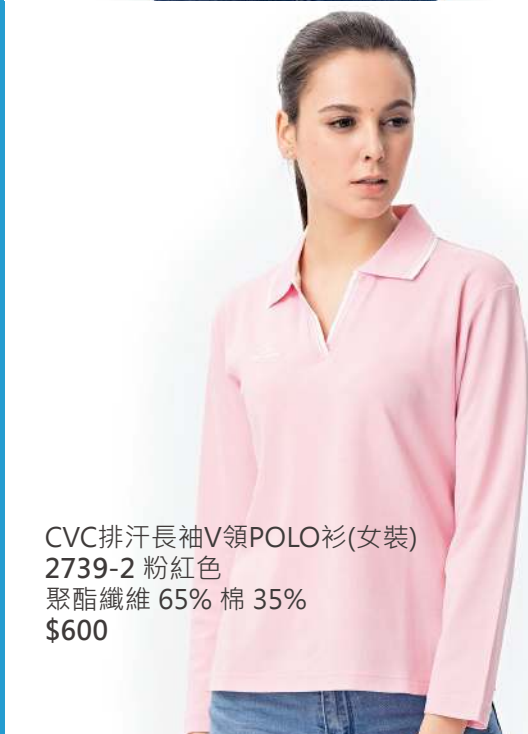
CVC排汗長袖V領POLO衫(女裝) 2739-2 粉紅色 聚酯纖維 65% 棉 35% $600