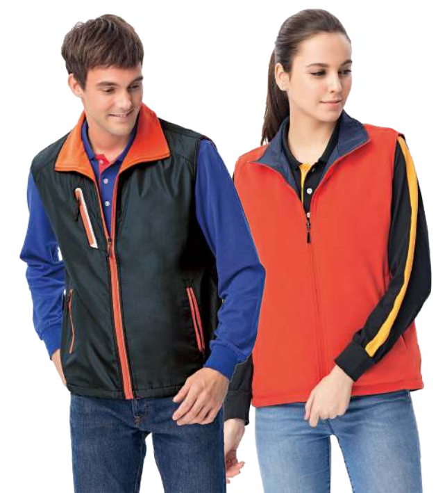
雙面穿搖粒背心 4632-1 丈青/橘紅 聚酯纖維 100% 複合布/搖粒布/防潑水處理 $1500