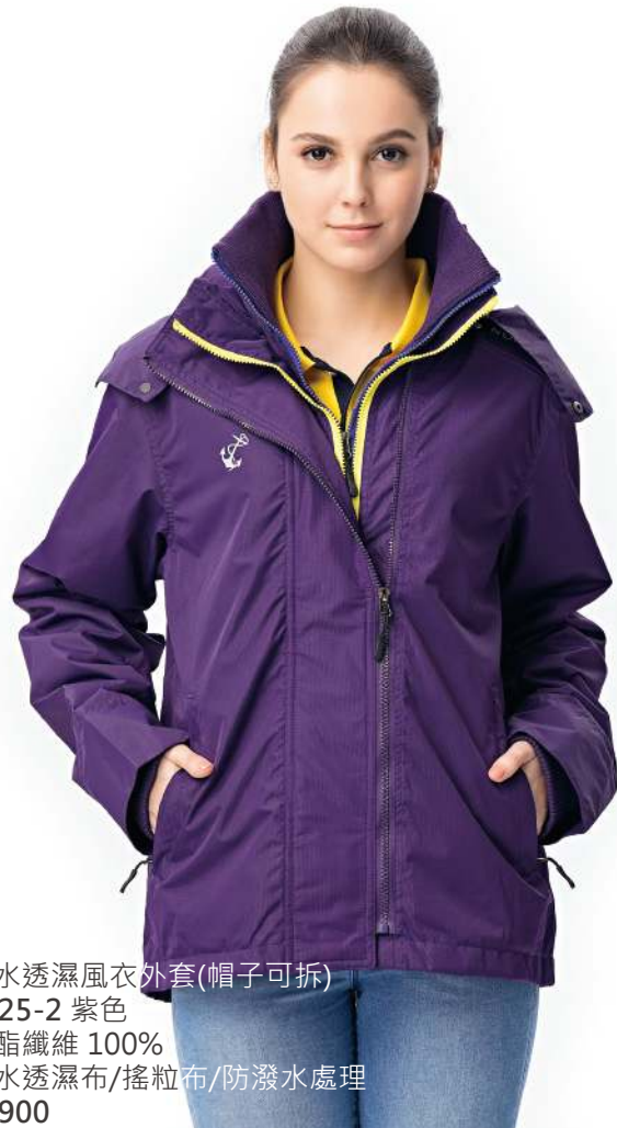
防水透濕風衣外套(帽子可拆) 4625-2 紫色 聚酯纖維 100% 防水透濕布/搖粒布/防潑水處理 $3900