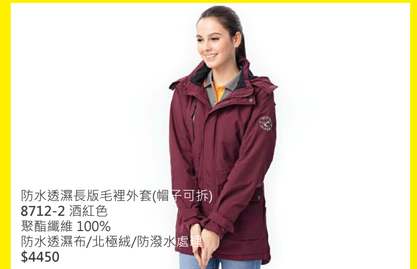
防水透濕長版毛裡外套(帽子可拆) 8712-2 酒紅色 聚酯纖維 100% 防水透濕布/北極絨/防潑水處理 $4450