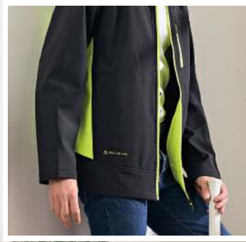
防水透濕軟殼機能外套(帽子可拆) 4946-1 黑色 聚酯纖維 92% 彈性纖維 8% 防水透濕軟殼布/防潑水處理 $3450