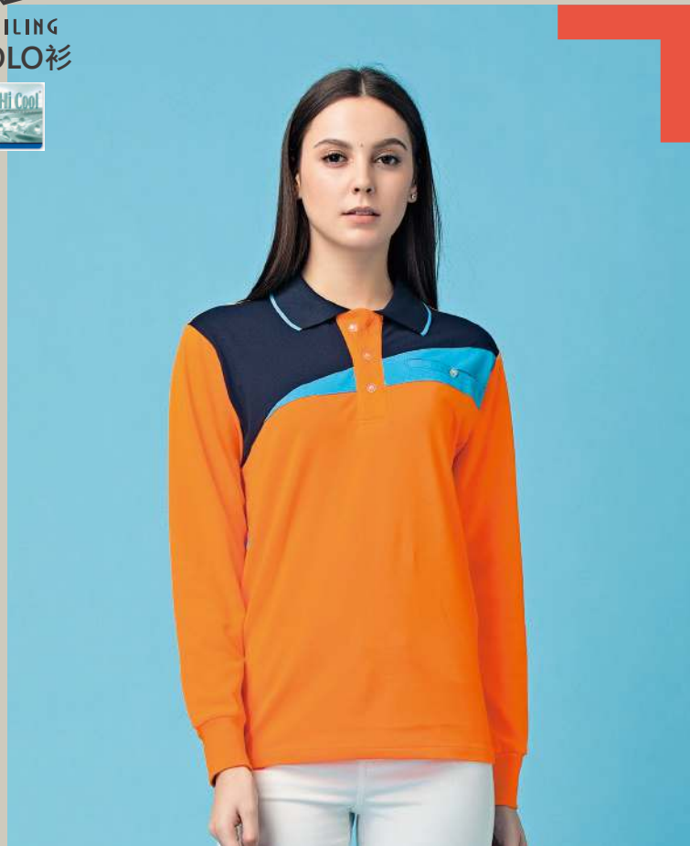
快乾棉長袖POLO衫 2542-2 橘色 天然棉 51.2% 聚酯纖維 48.8% 快乾棉排汗布(吸濕排汗原紗) $1300