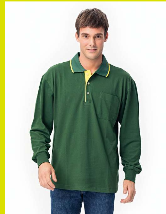
快乾棉長袖POLO衫 2013-3 墨綠色 天然棉 51.2% 聚酯纖維 48.8% 快乾棉排汗布(吸濕排汗原紗) $1100