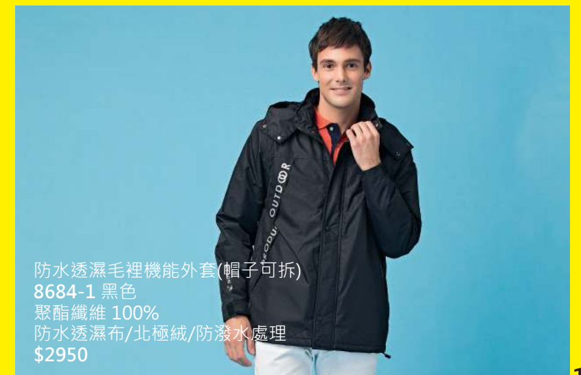
防水透濕毛裡機能外套(帽子可拆) 8684-1 黑色 聚酯纖維 100% 防水透濕布/北極絨/防潑水處理 $2950