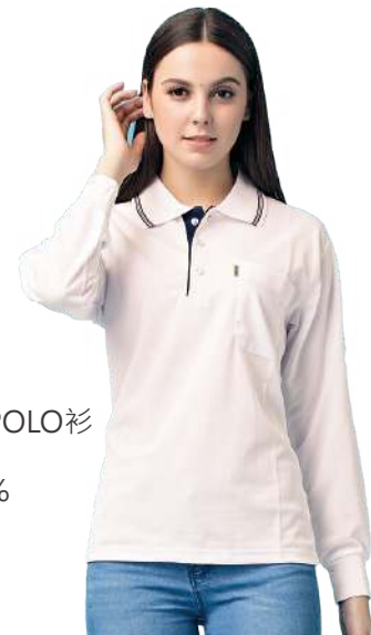
吸濕排汗長袖POLO衫 2791-1 白色 聚酯纖維 100% $700