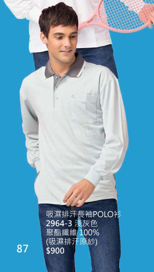
吸濕排汗長袖POLO衫 2964-3 淺灰色 聚酯纖維 100% (吸濕排汗原紗) $900