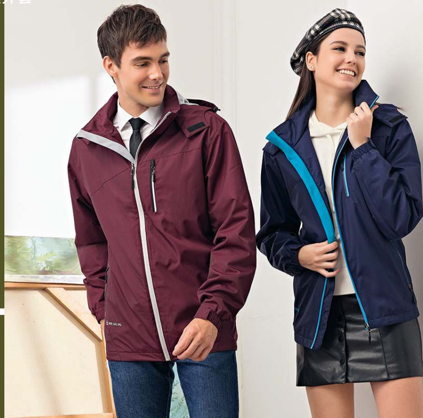
防水透濕搖粒機能外套(帽子可拆) 4945-3 酒紅色 聚酯纖維 100% 防水透濕布/搖粒布/防潑水處理 $2950