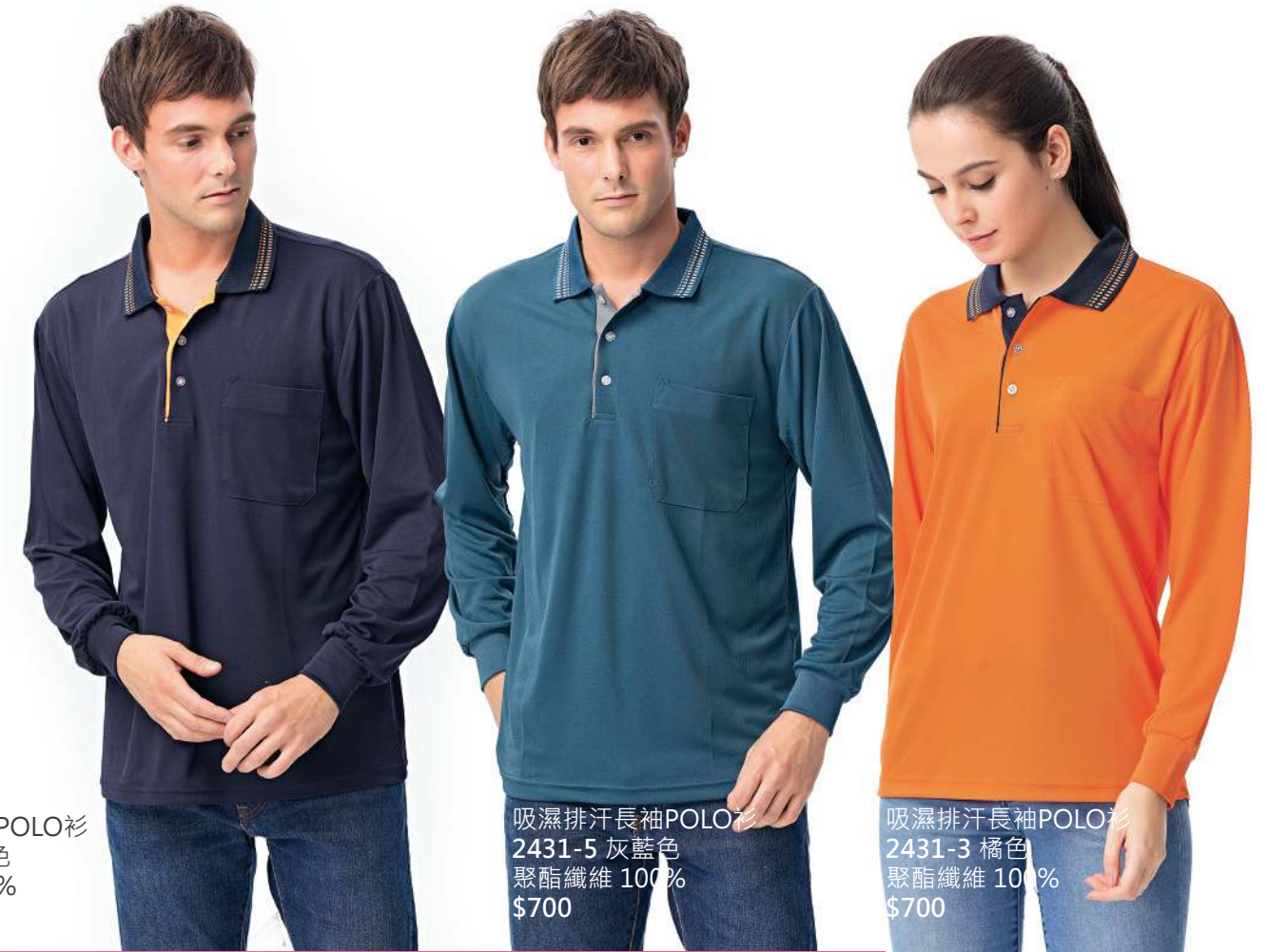
吸濕排汗長袖POLO衫 2431-2 丈青色 聚酯纖維 100% $700 吸濕排汗長袖POLO衫 2431-5 灰藍色 聚酯纖維 100% $700 吸濕排汗長袖POLO衫 2431-3 橘色 聚酯纖維 100% $700