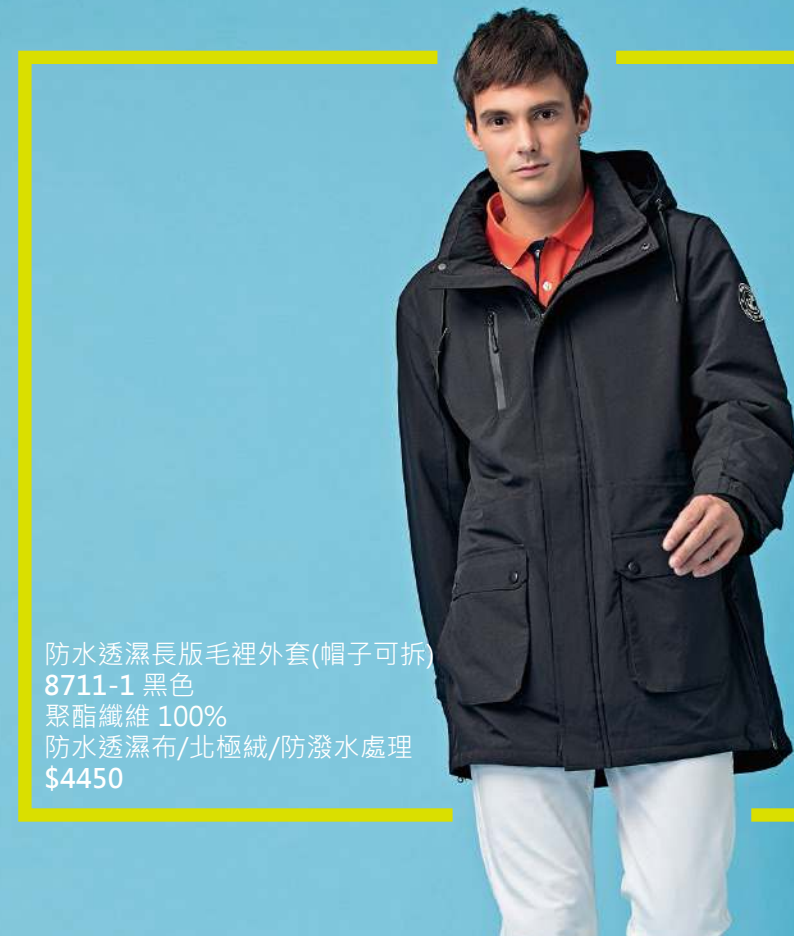
防水透濕長版毛裡外套(帽子可拆) 8711-1 黑色 聚酯纖維 100% 防水透濕布/北極絨/防潑水處理 $4450