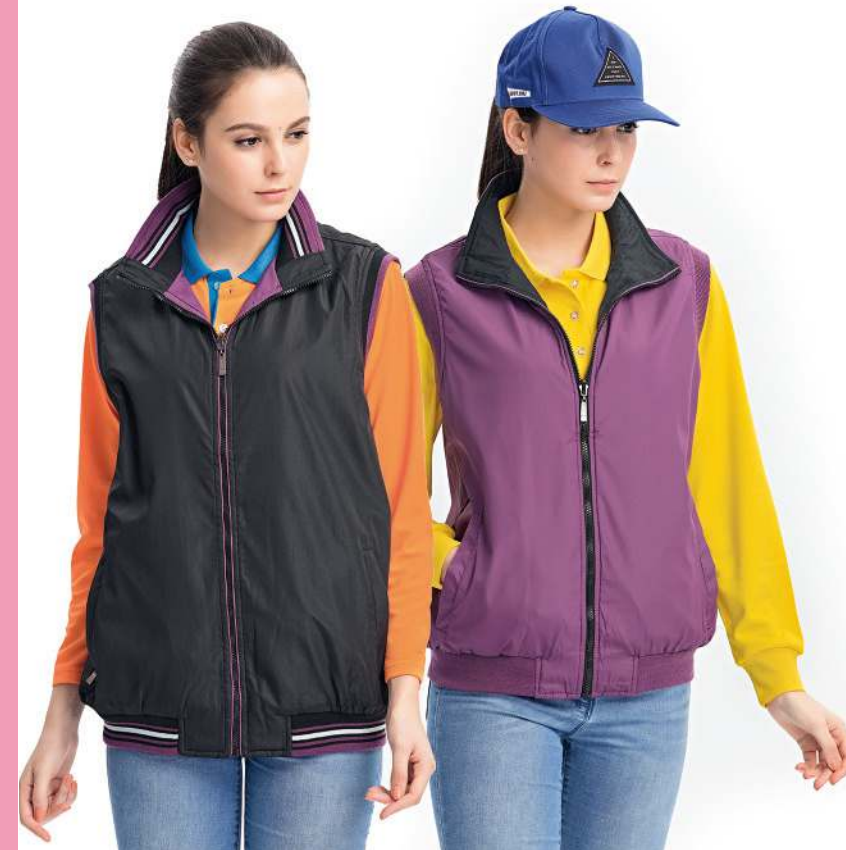
雙面穿鋪棉背心 4134-3 黑色/紫色 聚酯纖維 100% 複合布/輕鋪棉/防潑水處理 $1500