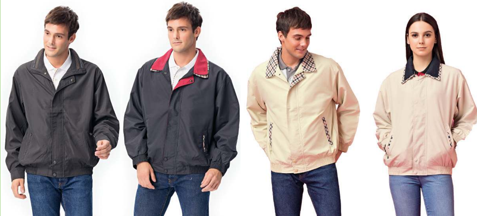
薄裡夾克 4144-1 深灰色 聚酯纖維 100% 高級複合布 $1750