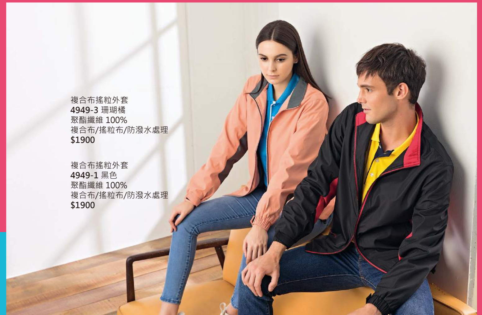
複合布搖粒外套 4949-3 珊瑚橘 聚酯纖維 100% 複合布/搖粒布/防潑水處理 $1900