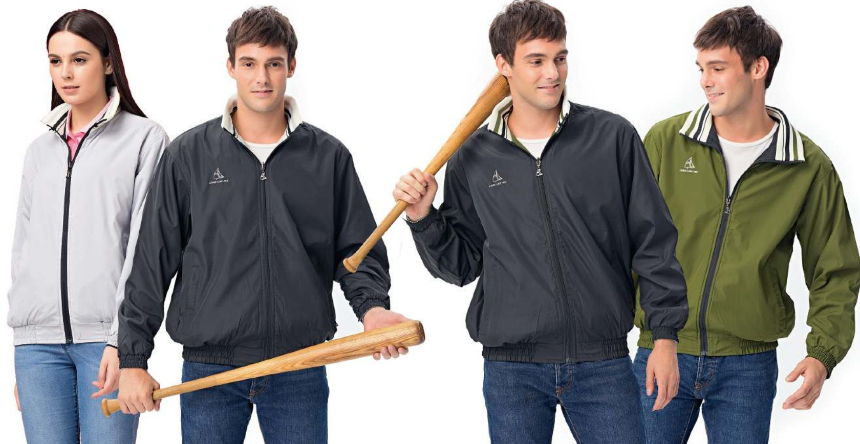
雙面穿鋪棉外套 4546-1 深灰/淺灰 聚酯纖維 100% 複合布/輕鋪棉/防潑水處理 $2300