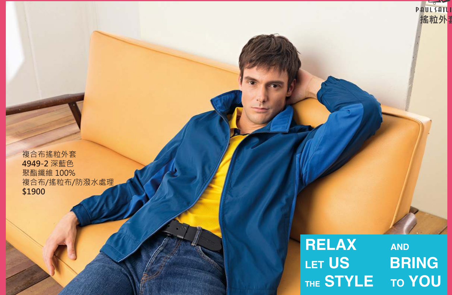
複合布搖粒外套 4949-2 深藍色 聚酯纖維 100% 複合布/搖粒布/防潑水處理 $1900