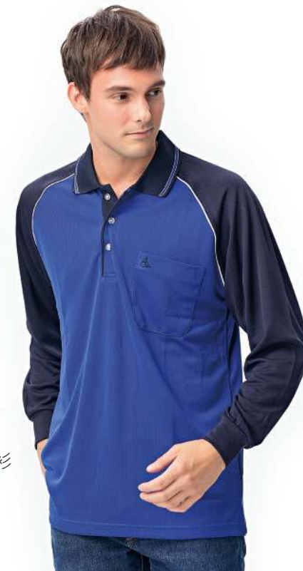
吸濕排汗長袖POLO衫 2812-3 寶藍色 聚酯纖維 100% (吸濕排汗原紗) $1200