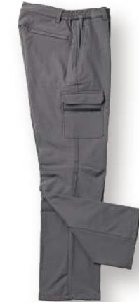
高彈力機能軟殼長褲 8834-2 灰色 聚酯纖維 92% 彈性纖維 8% 防水透濕軟殼布/防潑水處理 $2450