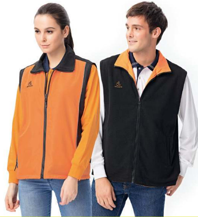
反光雙面穿搖粒背心 (可加4524-2外套) 4534-2 橘色/黑色 聚酯纖維 100% 複合布/搖粒布/防潑水處理 $1450