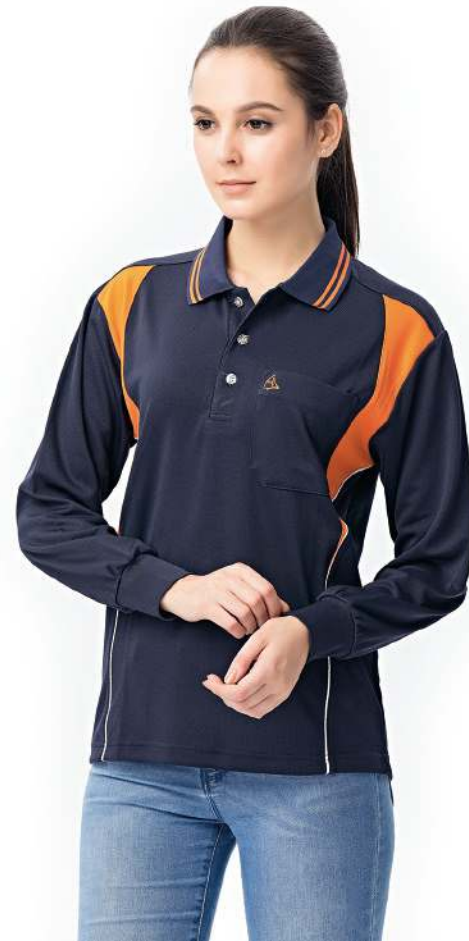
吸濕排汗長袖POLO衫 2241-2 丈青/橘色 聚酯纖維 100% (吸濕排汗原紗) $1250