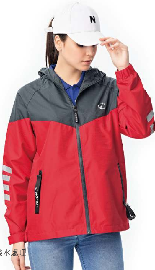
防水透濕反光機能外套 8831-2 紅色 聚酯纖維 100% 防水透濕布/網裡布/防潑水處理 $1950