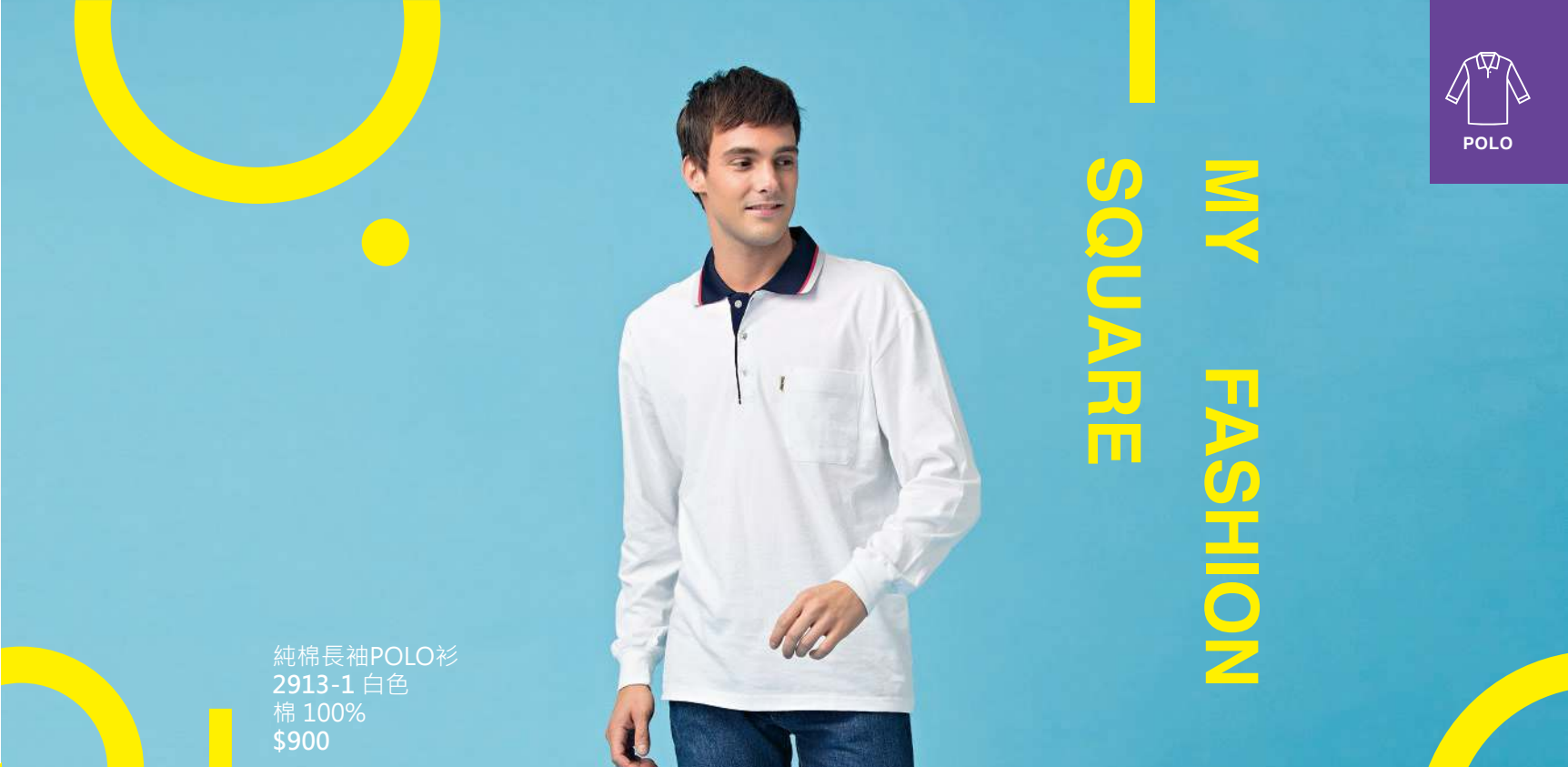
純棉長袖POLO衫 2913-1 白色 棉 100% $900