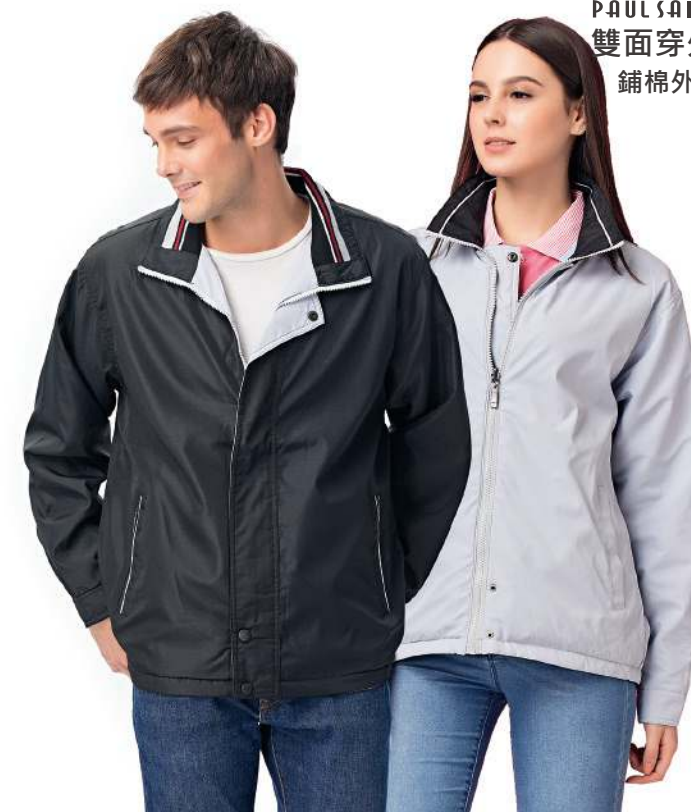
雙面穿鋪棉外套 4249-2 黑色/灰藍 聚酯纖維 100% 複合布/輕鋪棉/防潑水處理 $2300