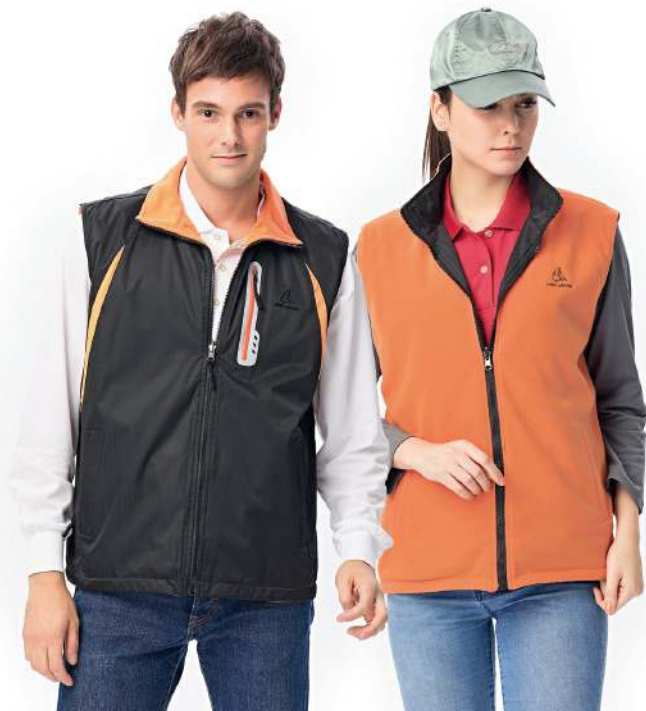
雙面穿搖粒背心 (可加4429-1外套) 4439-1 黑色/橘色 聚酯纖維 100% 風衣布/搖粒布/防潑水處理 $1450