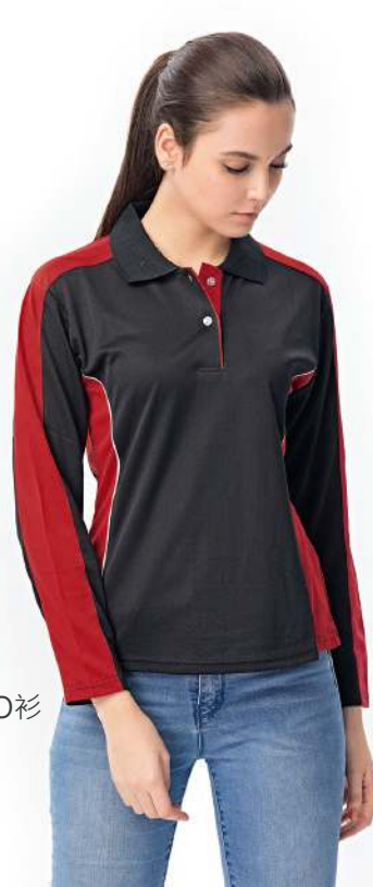
女款-吸濕排汗長袖POLO衫 2459-2 黑色 聚酯纖維 100% (吸濕排汗原紗) $1250