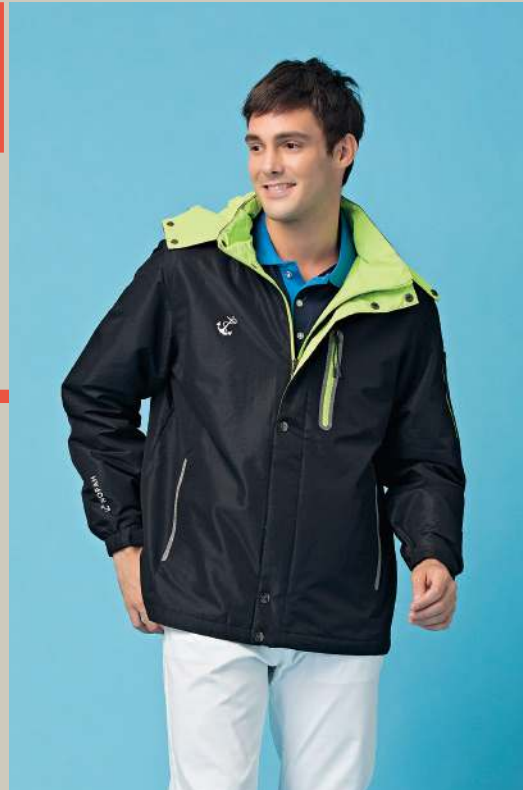
防水透濕毛裡機能外套(帽子可拆) 8837-1 黑色 聚酯纖維 100% 防水透濕布/北極絨/防潑水處理 $3250